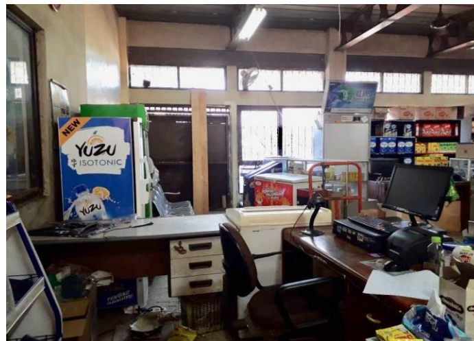
GAMBAR 1.3 Ruang Supermarket Koperasi

Ruangan terakhir atau yang menjadi ruangan utama adalah supermarket koperasi. Ditempat tersebut anggota bisa mengambil kebutuhan rumah tangga dan sembako yang sudah disediakan oleh pihak koperasi PT.Indo Bharat Rayon secara kredit dengan menunjukan nomor anggota koperasi.