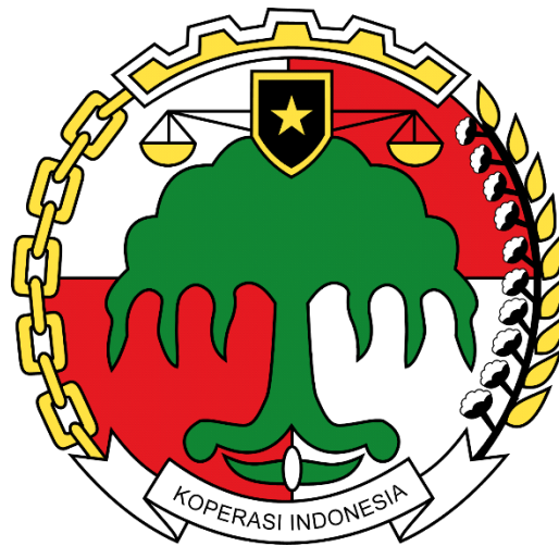
GAMBAR 1.4 Logo perusahaan