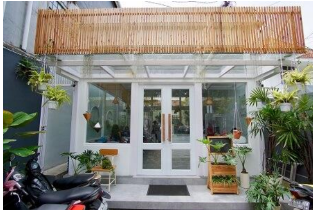
Gambar 1. 3 Sisi Luar Toko

Tampilan depan Sydwic Cafe terlihat seperti cafe biasanya, namun interior dan pemilihan aksesoris putih pada pintu membuat toko terlihat indah. Mungkin ini yang ingin disampaikan oleh sang pemilik, bahwa Cafe ini memiliki unsur modern dan minimalis.