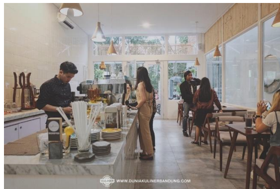
Gambar 1.5 Sisi Letak Toko

Sydwic Cafe memiliki beberapa area dengan layout-layout yang berbeda. Sehingga konsumen dapat memilih tempat dengan sesuka hati. Dengan menawarkan layout-layout yang berbeda disetiap area, maka konsumenpun dapat merasakan suasana yang berbeda pula, seperti di area ruangan depan yang menyatu dengan Coffee bar, disini merupakan ruangan dilarang merokok dan di bagian ini merupakan tempat para pengunjung memesan makanan dan membayar.