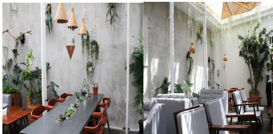
Gambar 1. 4 Sisi Interior Umum

Ketika pengunjung memasuki area utama, maka pengunjung akan langsung merasakan suasana yang nyaman dan berbeda. Karena langit-langitnya terbuat dari kaca dan pada dindingnya di beri aksesoris alami berwarna abu. Selain itu, dipasang juga dekorasi tumbuh-tumbuhan pada dinding. Furniture dari meja dan kursinya juga diatur dengan warna putih, coklat, dan abu-abu. Kesan alami, cozy , dan modern-minimalis sangat terasa di Café ini.