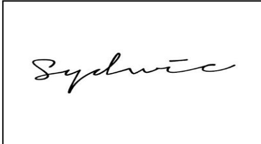
Gambar 1. 1 Logo Sydwic Kafe Bandung

menarik dapat membuat kepuasan tersendiri bagi konsumen dan kepuasan konsumen adalah prioritas utama bagi pihak manajemen Sydwic Café. Sebab hal tersebut akan berdampak positif bagi perkembangan usaha cafe itu sendiri.