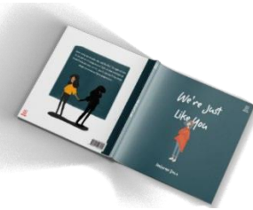
Gambar 4.6 Desain Sampul Buku