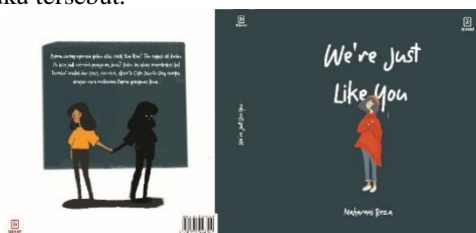
Gambar 4 5 Desain Sampul Buku

Penulis merancang sampul depan dan belakang buku dengan warna khas buku tersebut. Pada sampul buku tertulis judul buku yaitu “We’re Just Like You”, nama penulis, dan nama penerbit, kode ISBN, serta synopsis dari buku tersebut.