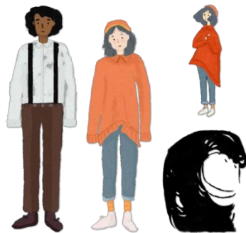
Gambar 4. 4 Ilustrasi Karakter