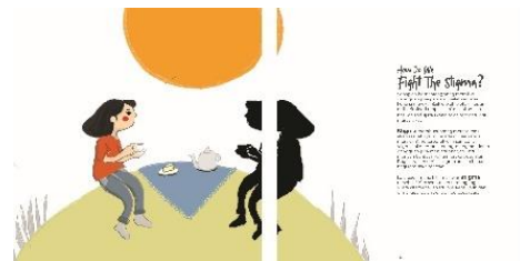
Gambar 4.7 Desain Isi Buku