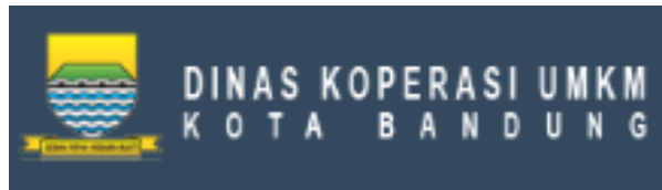
Gambar 1.1 Dinas Koperasi dan UMKM Kota Bandung