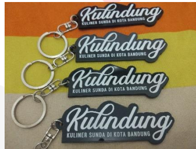
Gambar Gantungan Kunci