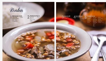
Gambar Daftar Isi