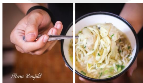
Gambar Halaman Kategori Isi