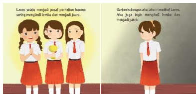
Gambar 11. Hasil Perancangan