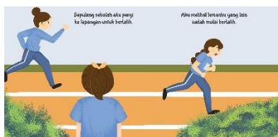
Gambar 12. Hasil Perancangan