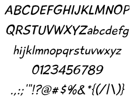
Gambar 4. Playtime Font

Tipografi Isi buku menggunakan font sans serif mengikuti hasil analisis matriks.