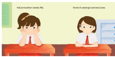
Gambar 10. Hasil Perancangan