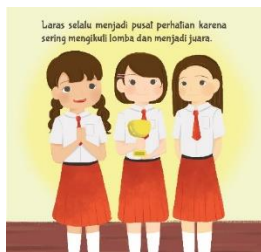
Gambar 1. Ilustrasi

Ilustrasi yang digunakan adalah dengan menggunakan gaya ilustrasi kartun ilustrasi yang digunakan ditujukan untuk membantu informasi dapat tersampaikan dengan baik dan membantu anak-anak untuk memahami buku bacaan.