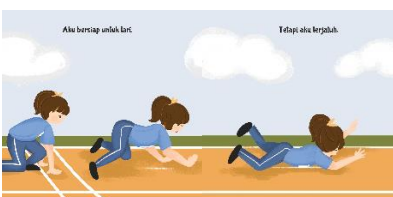
Gambar 14. Hasil Perancangan