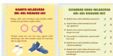
Gambar 15. Hasil Perancangan