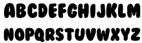
Gambar 3. BubbleGum Font

Judul yang digunakan dalam perancangan menggunakan font sans serif mengikuti hasil analisis matriks.