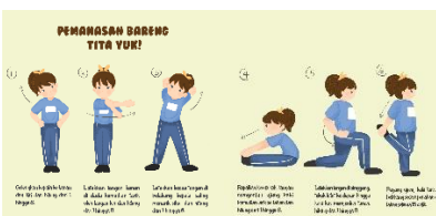
Gambar 13. Hasil Perancangan