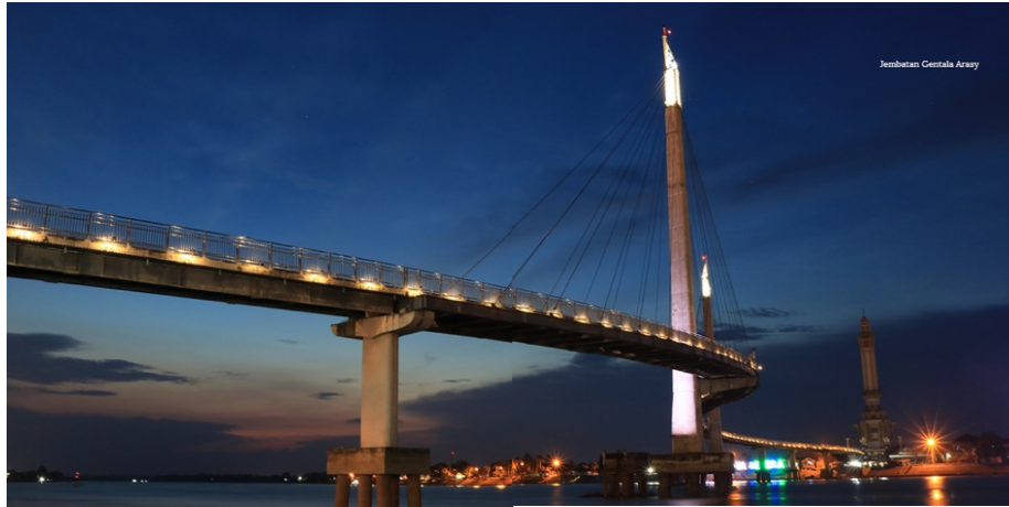
Gambar 1. 4 Halaman Isi