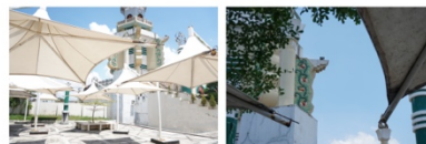
Gambar 1. 5 Halaman Isi

Menara yang dibangun dengan ketinggian mencapai 60 meter ini disebut dengan Menara Gentala Arasy. Bangunan Menara ini menggunakan anatomi Islam dari Timur Tengah yang diadopsi dengan bentuk ornamen ciri khas Jambi, hal ini dikarenakan Menara dibangun dengan tujuan untuk menghangat kembali perkembangan Islam di Jambi. Masa dari itu, Gentala Arasy menyediakan koleksi sejarah dan budaya Islam di Provinsi Jambi yang dapat dilihat pengunjung pada bagian bawah Menara Gentala Arasy.