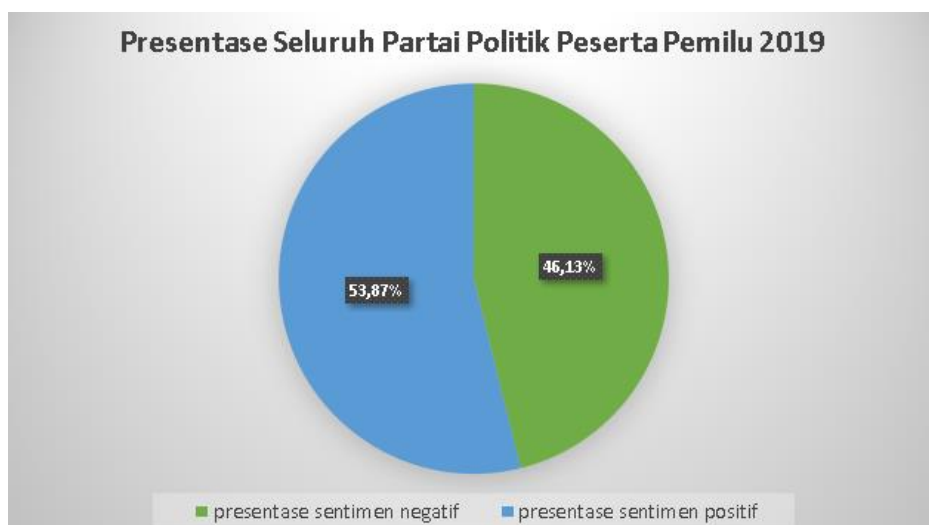
Gambar 3 Hasil Persentase Positif dan Negatif seluruh partai

Dari hasil pengujian pada Naïve Bayes Classifier , didapatkan nilai rata-rata F1 measure 80,16% dan rata-rata Akurasi 78,03%. Berdasarkan hasil tersebut, juga didapatkan hasil prediksi positif dan negatif terhadap partai seperti berikut,