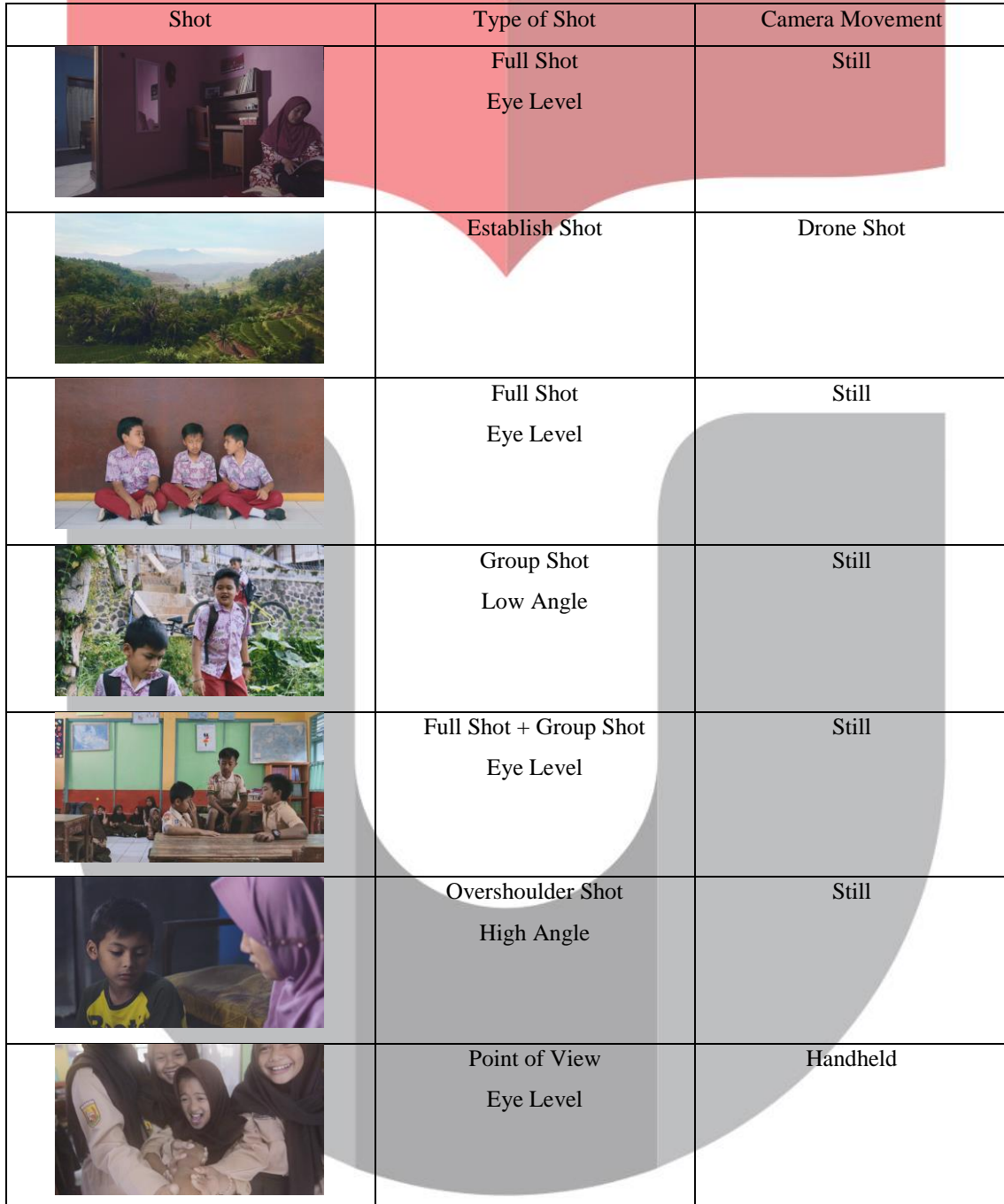
Tabel Hasil Perancangan