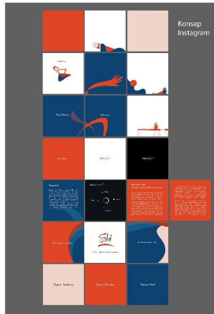
Gambar 4. 3 Konsep visual feed keseluruhan

Feed Instagram yang akan menghadirkan pengenalan dan promosi Bahasa isyarat SIBI dan web Signsibi.com.