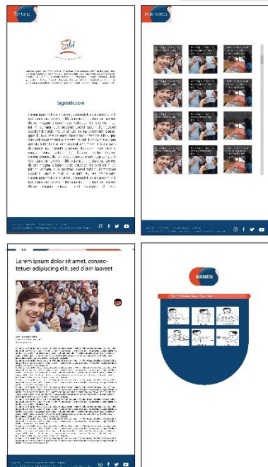
Gambar 4. 2 Kamus dan halaman pendukung