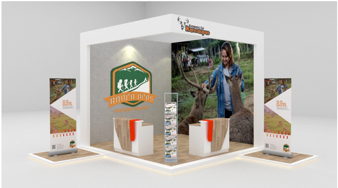
Gambar 3.4.6 Hasil Rancangan Booth Tourism