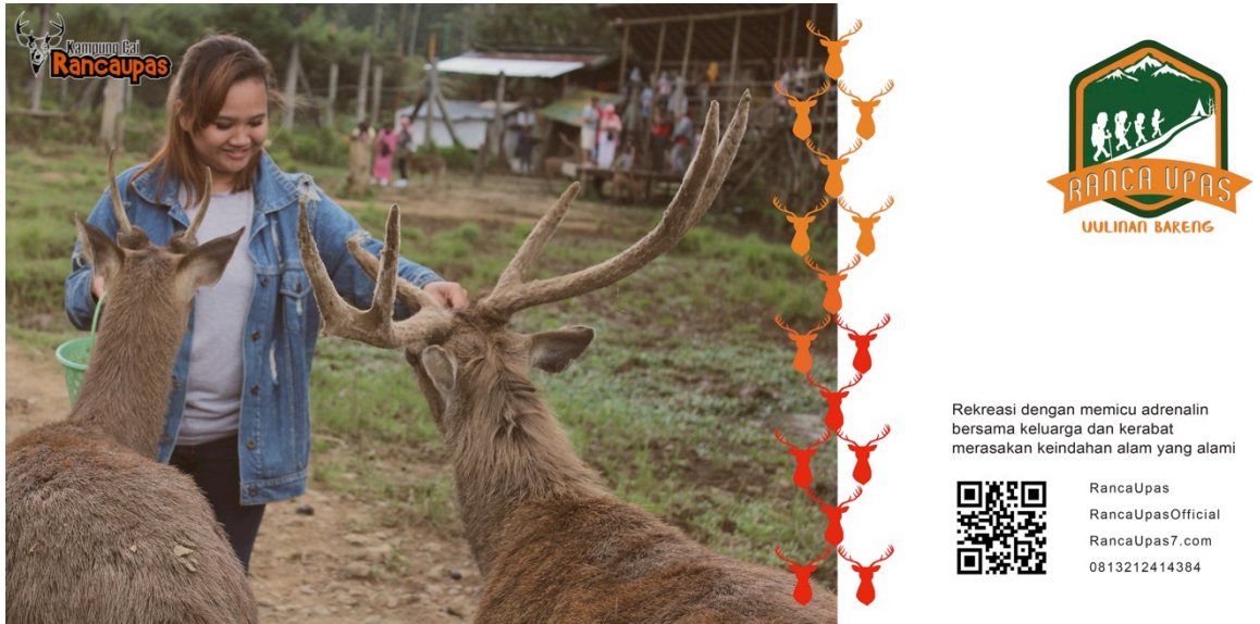
Gambar 3.4.5 Hasil Rancangan Billboard