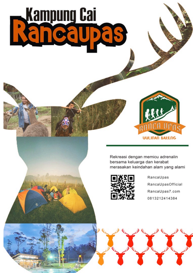
Gambar 3.4.3 Hasil Rancangan Poster Utama