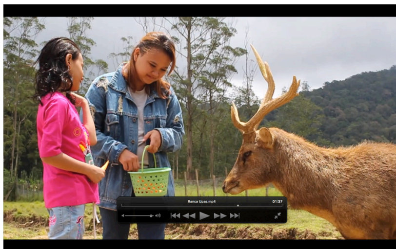
Gambar 3.4.4 Hasil Rancangan Sendiri