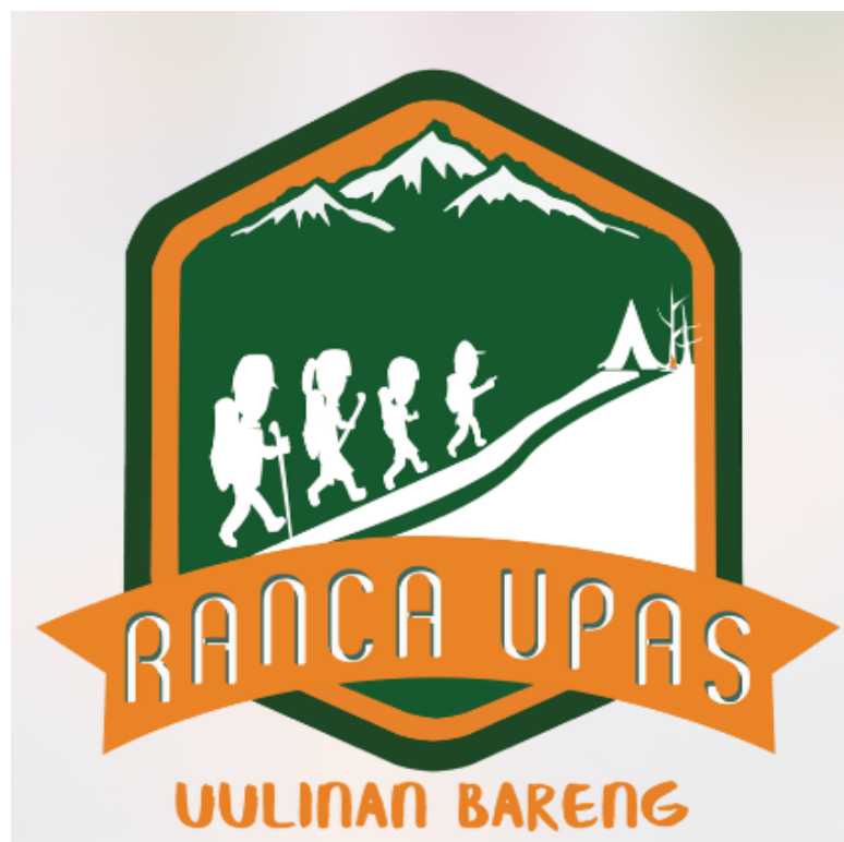
Gambar 3.4.1 Hasil Rancangan Logo Program Tematik