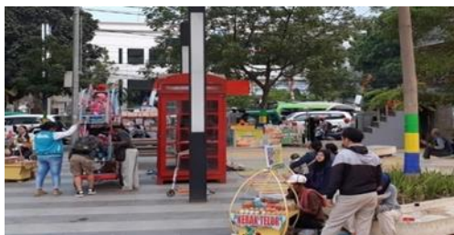
Gambar 2 Dokumentasi Alun-Alun Ujungberung

Menurut Suharsaputra (2014:215) dokumentasi merupakan rekaman kejadian masa lalu yang tertulis atau dicetak mereka dapat berupa surat, buku harian, catatan-catatan dan dokumen-dokumen. Manfaat dari tipe-tipe dokumen ini dan yang lain tidaklah selalu disandarkan pada keakuratan atau kekurangan-biasanya.