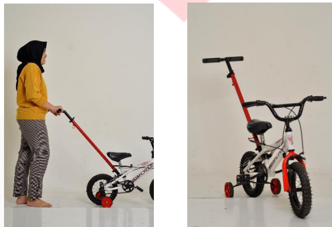
Gambar 4. 2 Final Produk (Data Penulis,2019)