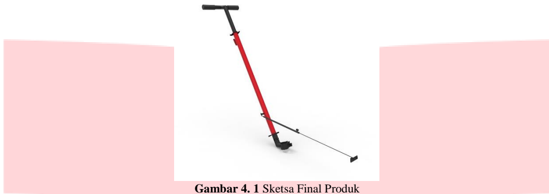
Gambar 4. 1 Sketsa Final Produk (Data Penulis,2019)