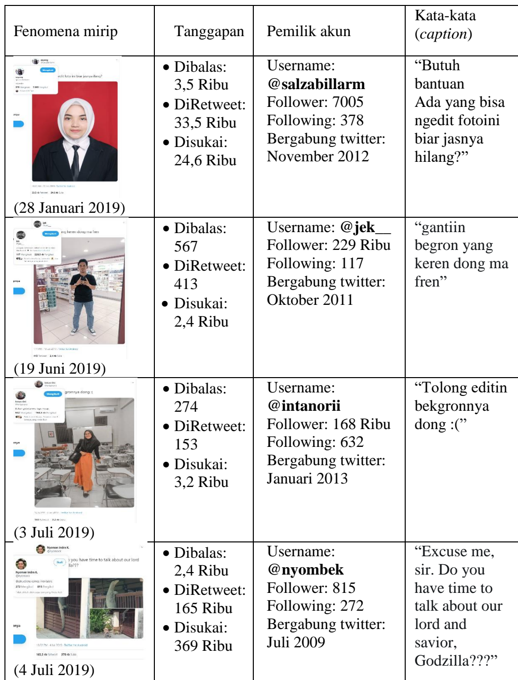
Tabel 1.1 Fenomena Meme

Di Indonesia penelitian tentang penyebaran konten digital meme dilakukan oleh (Nugraha, et.al 2015), dalam penelitiannya bertujuan untuk mengetahui motif seseorang dalam menciptakan sebuah konten meme yang disebar dan dibagikan melalui internet. Fenomena penyebaran konten digital yang viral di Indonesia juga sudah banyak terjadi. Beberapa diantaranya fenomena minta editin dalam platform media sosial twitter yang pernah trending.