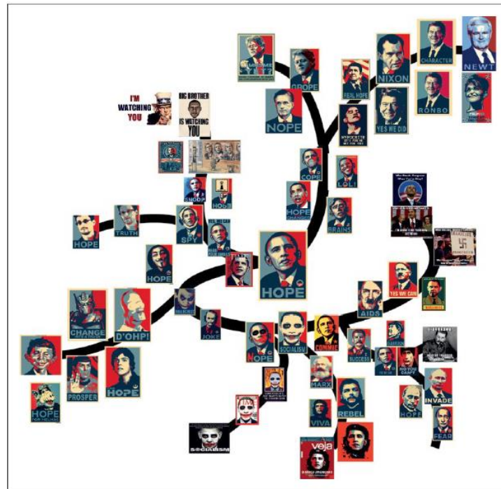
Gambar 1. 1 Diagram percabangan dari perpecahan dan mutasi Obama Hope Meme Karakteristik yang sama yaitu: gambar wajah, warna, dan kepala. (Seiffert-Brockmann et al., 2018)

Berangkat dari penelitian Brockman, hal itu selaras dengan pernyataan dari Dawkin bahwa meme merupakan suatu unit budaya yang diimitasi dan ditransmisikan dari orang ke orang melalui internet (Shifman, 2014). Brockman menjelaskan bahwa evolusi meme Obama Hope menggambarkan bahwa meme dapat berevolusi dengan membawa sejumlah maksud dan makna baru sesuai dengan proses imitasi dan peniruan terhadap budaya populer atau pemberitaan media massa yang sedang berkembang.