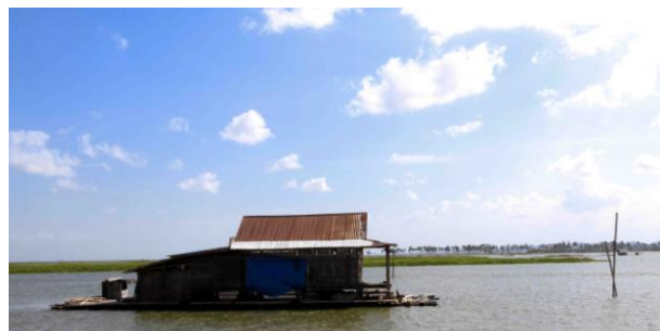
Gambar 1.1 Gambar Lokasi

Dalam pembuatan program dokumenter televisi ini, penulis mengambil lokasi di kabupaten Wajo, Sulawesi Selatan. Lebih tepatnya terletak di desa salo tengah , yang berada di pemukiman rumah apung yang ada di danau Tempe. Lokasi pemukiman warga yang bertempat tinggal di rumah apung membutuhkan waktu sekitar kurang lebih 45 menit dari kota sengkang dengan menggunakan perahu, rumah apung yang ada di danau tempe kurang lebih 40 unit.