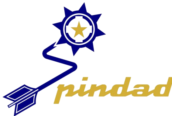
Gambar 1. 1 Logo PT Pindad Persero

Logo merupakan suatu lambang atau simbol dan tulisan yang menjadikan identitas suatu perusahaan. Pada gambar 1.1 menunjukkan logo PT Pindad bergambar cakra yang terdiri dari bintang segi lima, pisau frais dengan 4 buah lubang spi dan 8 buah pisau (cakra), batang dan ekor. Logo ini memiliki arti dengan memproduksi sarana Hankam dan Komersial, perusahaan melaksanakan misi strategisnya sebagai industri perang dan industri damai (PT. Pindad Persero, 2014).