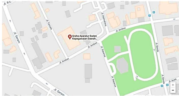
Gambar 1.1 Lokasi Penelitian

Pelaksanaan kegiatan penelitian bertempat di Badan Kepegawaian Daerah Bandung yang berlokasi di Jalan Ternate No.2, Citarum, Bandung Wetan, Kota Bandung, Jawa Barat 40115.