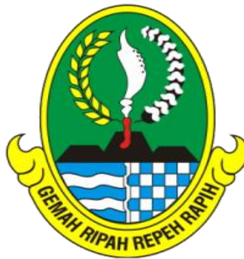
Gambar 1.1 Logo Instansi

Badan Kepegawaian Daerah sendiri memiliki logo yaitu sebagai berikut: