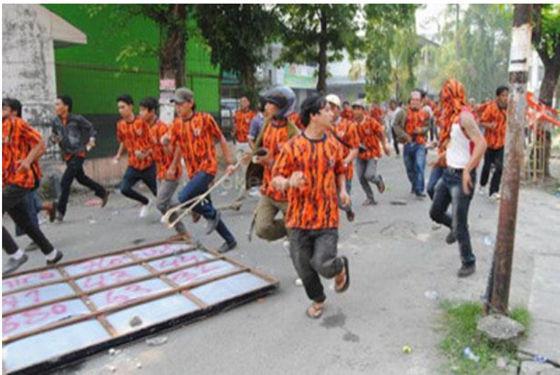
Gambar 1.2 Konflik PP dan FBR 2014