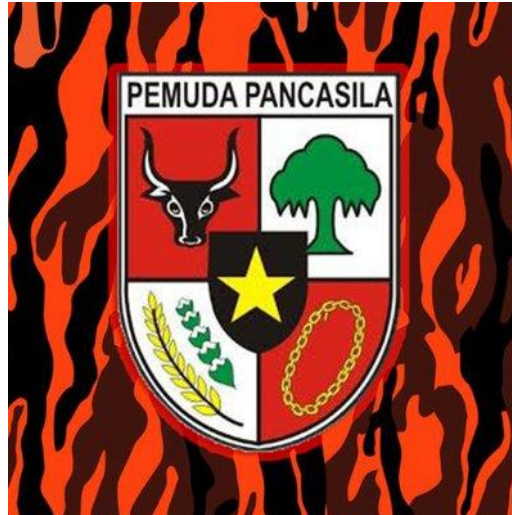
(gambar 1.1 Logo Pemuda Pancasila)

Jakarta Selatan merupakan kota Administrasi dibawah provinsi DKI . Jakarta Selatan berbatasan dengan Jakarta Barat dan Jakarta Pusat . Jakarta Selatan merupakan kota administrasi yang memiliki kekayaan dibanding wilayah lainnya, wilayah ini mempunyai banyak perumahan kelas menengah ke atas dan merupakan sebuah tempat pusat bisnis.