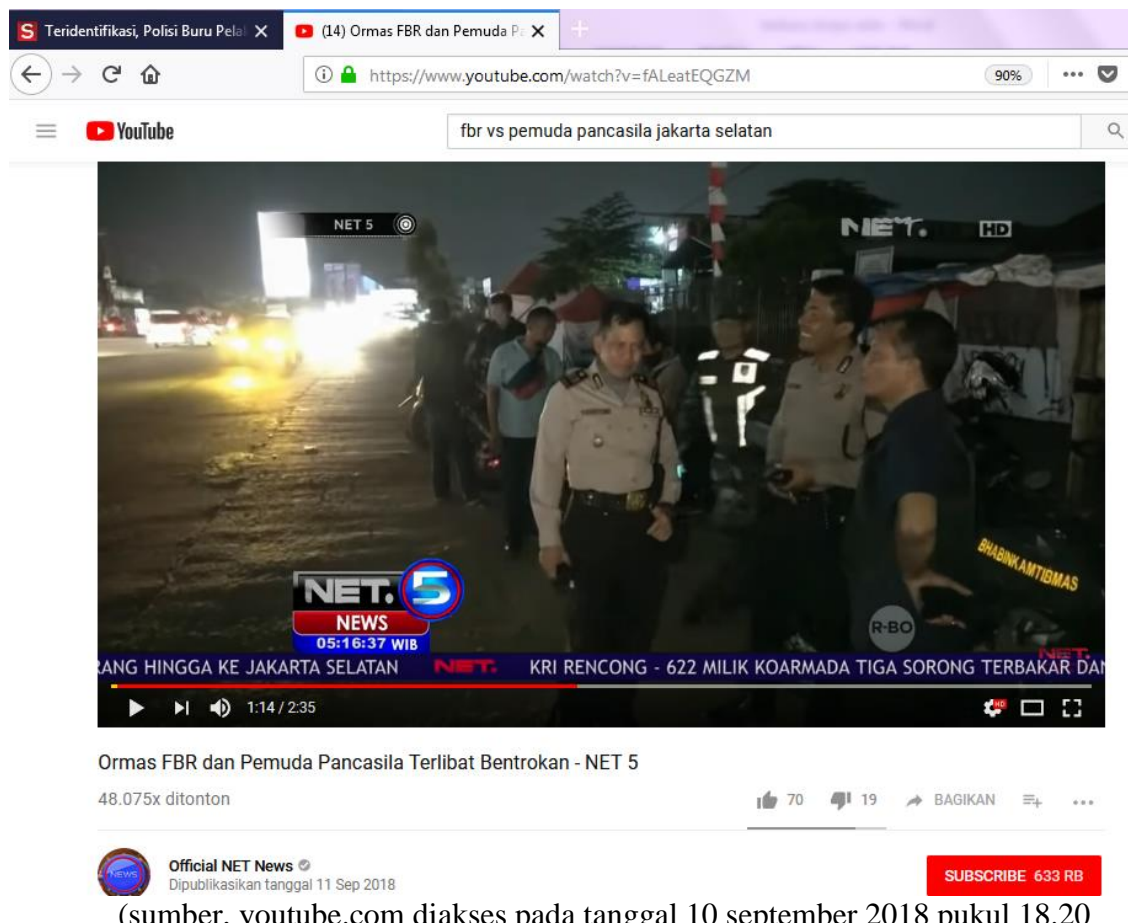
Gambar 1.4 Video Youtube tentang kejadian bentrok antar Ormas