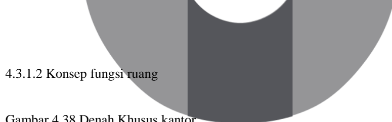
Gambar 4.37 Area sirkulasi kantin

Sirkulasi pada kantor guru diarahkan dari pintu masuk mengikuti selasar ruangan, kantor guru yang berada tepat dalam satu lantai dengan ruang kepala sekolah, wakil kepala sekolah memudahkan komunikasi antar guru dengan kepala sekolah maupun wakil kepala sekolah, begitu juga dengan ruang tata usaha.