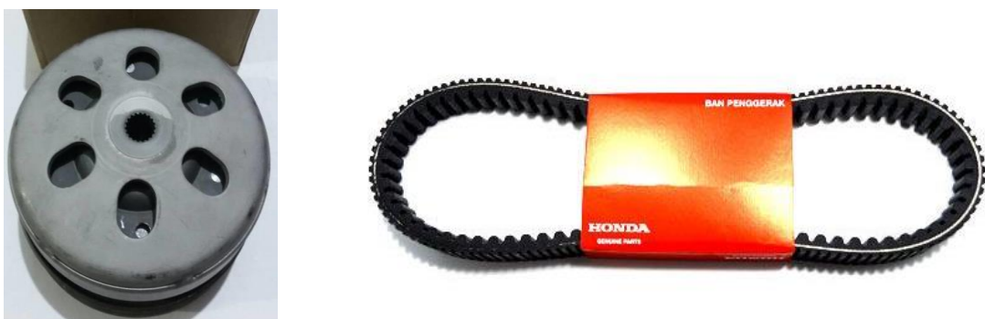
Gambar I.1 Pulley Assy dan Belt Drive

Pada fasilitas Plant 3 ini, terdapat 10 lini produksi, salah satunya adalah Assembly Engine atau biasa disebut Assy Engine . Lini produksi ini merupakan tempat dimana unit mesin sepeda motor merk A tipe K93 dirakit. Salah satu stasiun kerja pada lini Assembly Engine adalah stasiun kerja Pulley Assy Driven , yang disebut dengan stasiun kerja M23. Pada stasiun kerja ini part pulley assy dan belt drive dirakit kedalam part crankcase yang berada di atas conveyor yang berjalan. Gambar I.1 menunjukkan part pulley assy dan belt drive , Gambar I.2 menunjukkan part pulley assy dan belt drive yang sudah dirakit pada crankcase .