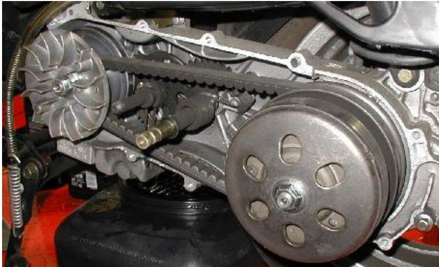
Gambar I.2 Pulley Assy dan Belt Drive yang sudah dirakit pada crankcase

Dalam memproses perakitan pulley assy dan belt drive tersebut, urutan pekerjaan yang dilakukan oleh operator ditunjukkan pada diagram alir pada Gambar I.3: