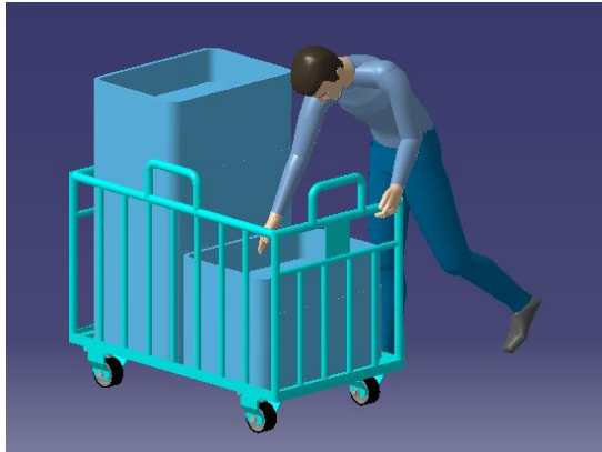
Gambar I.4 Ilustrasi postur tubuh tumpukan ketiga