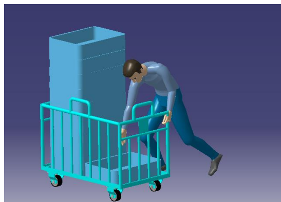
Gambar I.6 Ilustrasi postur tubuh tumpukan terbawah

Postur kerja tersebut disebabkan karena kereta MHE tidak bisa diatur ketinggiannya sehingga mengharuskan operator mengambil dengan cara membungkuk dengan tumpuan satu kaki untuk menjangkau part pada keranjang tumpukan bawah.