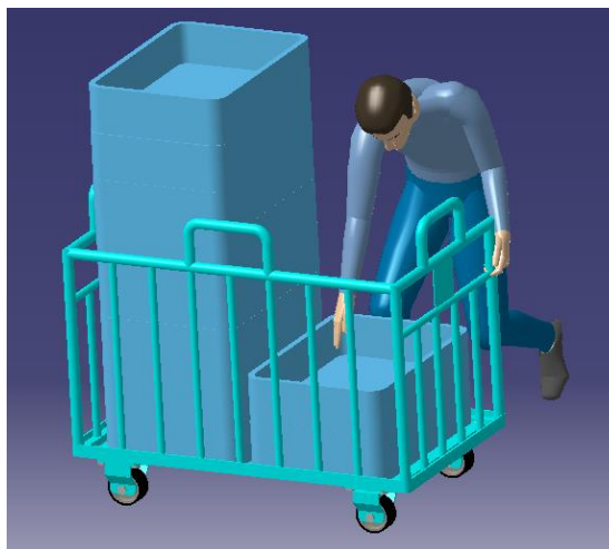
Gambar I.5 Ilustrasi postur tubuh tumpukan keempat