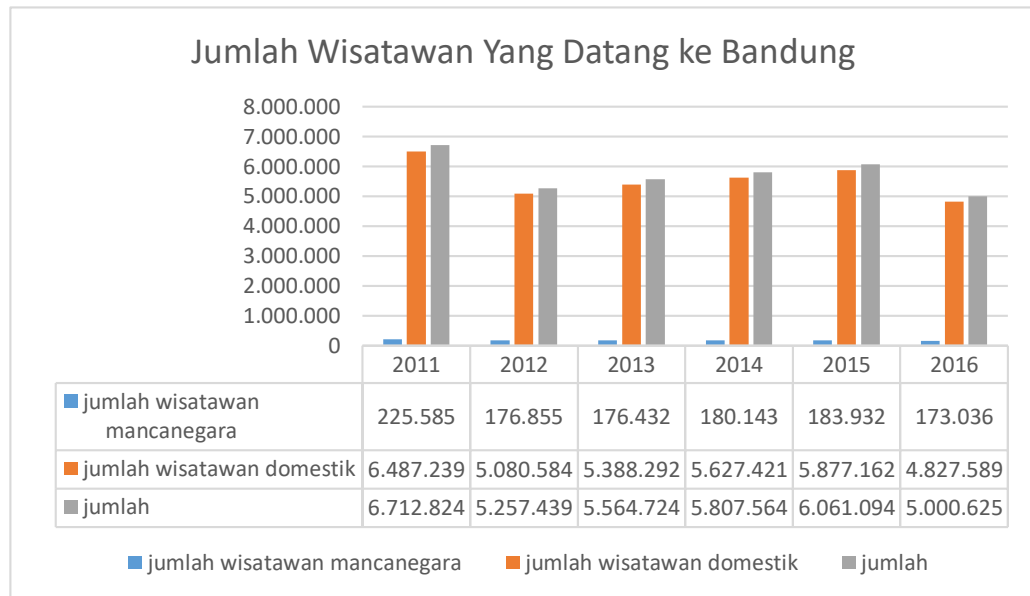
Gambar I.2 Jumlah wisatawan yang datang ke kota bandung

1.2%. Walaupun demikian peluang bisnis pada indsutri pariwisata di Kota Bandung memiliki peluang yang cukup besar dikarenakan banyak pengunjung yang datang ke Kota Bandung dan memiliki kemungkinan untuk menginap di Kota Bandung. Berikut merupakan jumlah wisatawan yang menginap di Kota Bandung berdasarkan Pejabat Pengelola Informasi dan Dokumentasi (PPID) Kota Bandung: