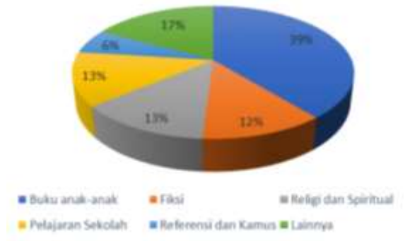
Gambar I. 1 Penjualan Buku di Toko Buku Gramedia Indonesia

tentunya keduanya dapat membantu pembelajaran dan penerapan ilmu kepada keluarga dan juga masyarakat. Berdasarkan Gambar I.1 pangsa pasar buku di Toko Buku Gramedia Indonesia tahun 2015 yang tertinggi adalah buku anak-anak, yaitu sebesar 39 %.