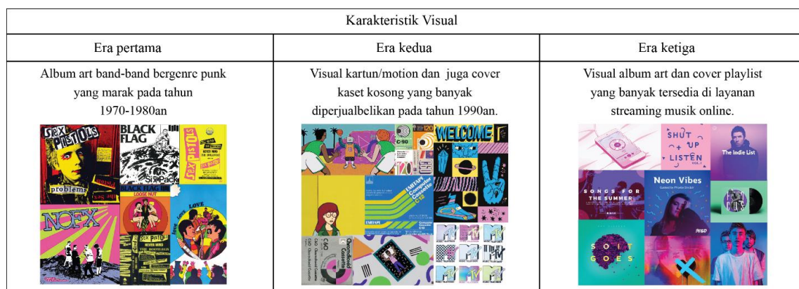
Tabel 1. Karakteristik Visual

Pengayaan visual yang terdapat pada sebuah cover mixtape , yang digunakan untuk menggambarkan isinya sangatlah beragam. Keberagaman ini kembali lagi, tergantung pada isi dan waktu kapan mixtape itu dibuat. Pada era analog mixtape memiliki cara pembuatan yang manual, dibuat secara manual, digambar secara manual, hingga ditulis secara manual. Perubahan ke era digital tentu sangat terlihat. Kini visual sebuah mixtape dibuat di perangkat lunak komputer, seperti dengan Adobe Photoshop dan Illustrator. Sehingga terdapat berbagai macam bentuk gaya berdasarkan eranya masing-masing.