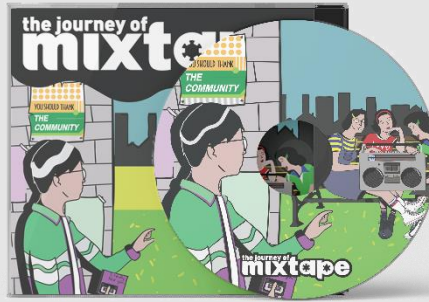
Gambar 5. Mixtape CD