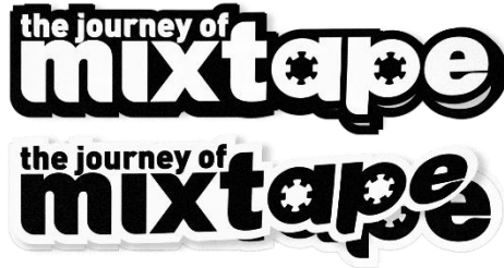
Gambar 8. Sticker