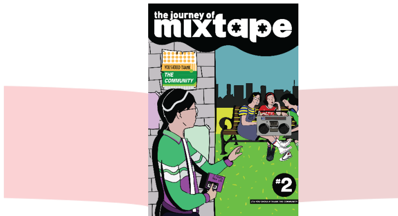
Gambar 2. Hasil Perancangan Cover #2

Sedangkan seri kedua yang berjudul “You Should Thank The Community” memiliki makna yang kurang lebih sama dengan seri pertama, dimana mixtape tidak akan ada tanpa orang-orang dalam komunitas anak muda yang terus menerus mengembangkannya dengan cara saling berbagi.