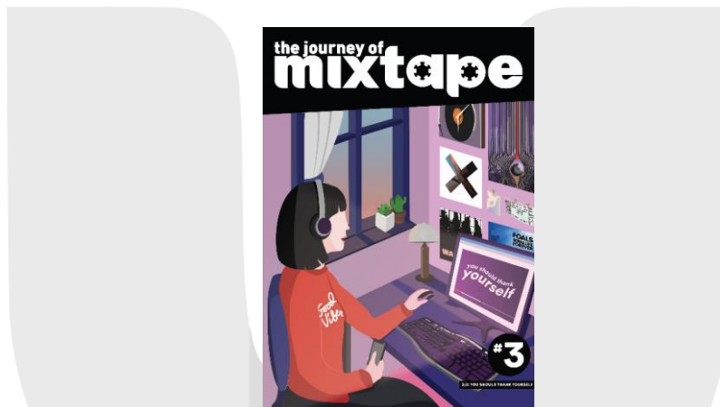
Gambar 3. Hasil Perancangan Cover #3

Yang terakhir, yaitu seri ketiga yang berjudul “You Should Thank Yourself” dimana mixtape tidak akan tetap ada, tanpa orang-orang yang terus membuat dan mendengarkannya, bahkan dalam bentuk format yang berbeda-beda.