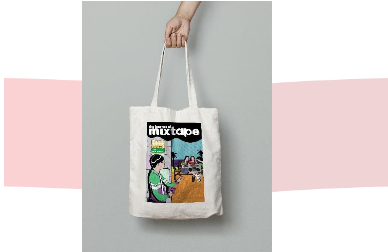
Gambar 12. Tote Bag