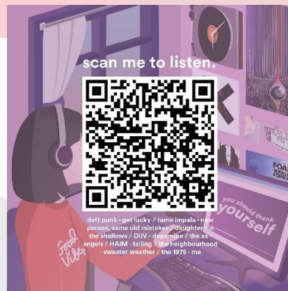
Gambar 6. Mixtape QR Code