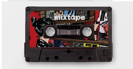
Gambar 4. Mixtape Kaset