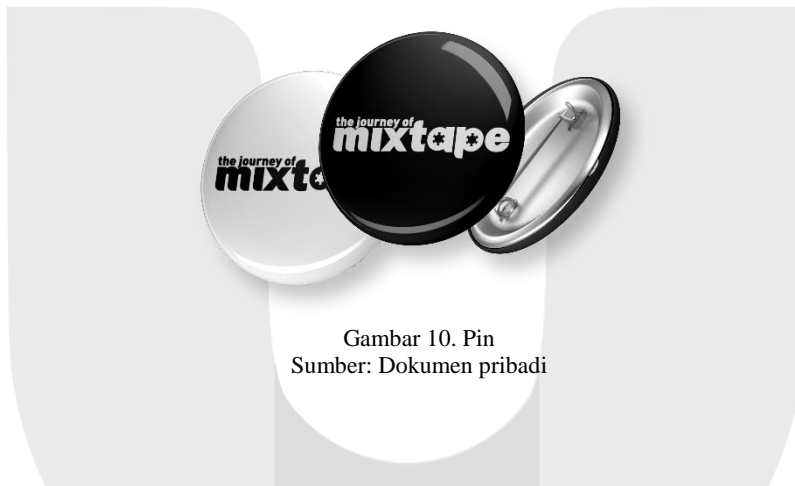
Gambar 10. Pin