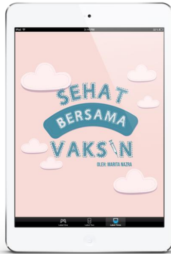
Gambar 9 Buku dalam versi digital / E-Book (media Utama)