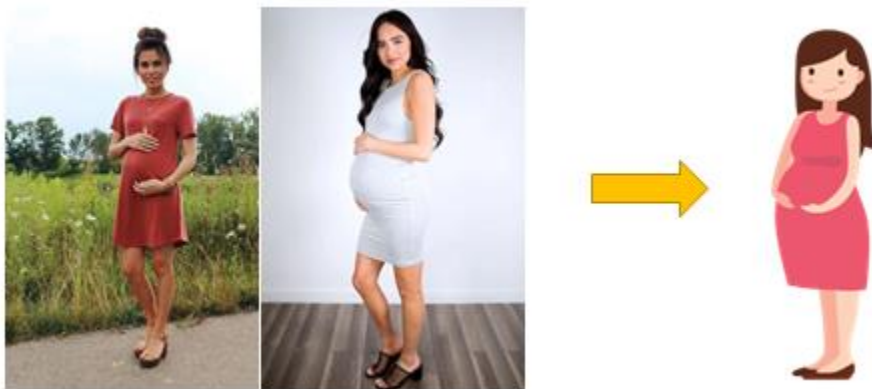
Gambar 2 gambaran bentuk Ibu Hamil