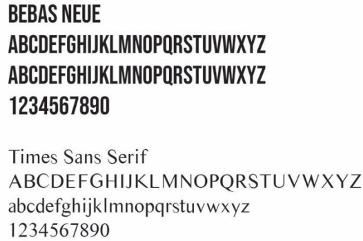
Gambar 7 Tipografi

Tipografi yang akan digunakan dalam perancangan media informasi ini yaitu dengan menggunakan font KG Blank Space untuk Headline , Poetsen One untuk Quote/Caption , dan Times Sans Serif untuk Body Copy .