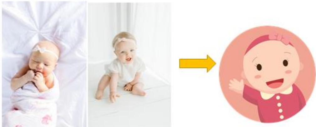
Gambar 5 gambaran bentuk Anak Balita