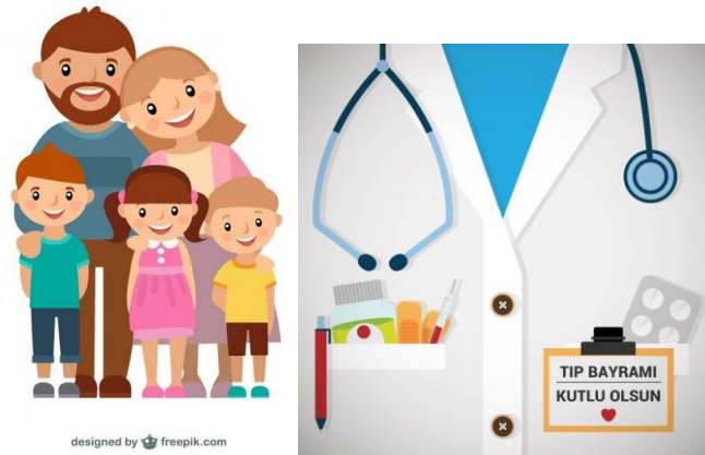
Gambar 1 Gaya Visual