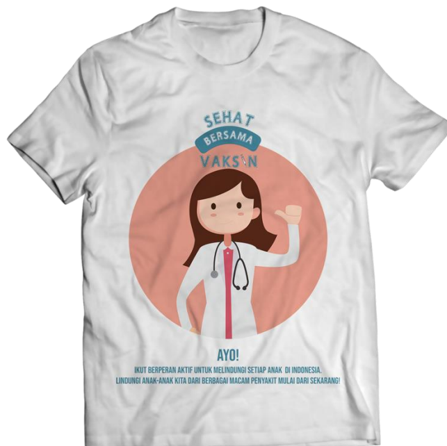
Gambar 15 T-Shirt (Merchandise)