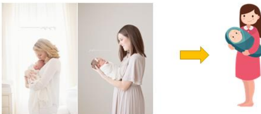
Gambar 3 gambaran bentuk Ibu dan Anak