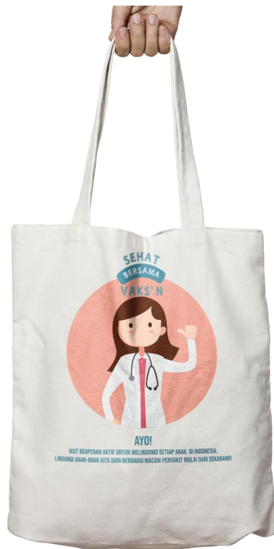
Gambar 13 Totebag (Merchandise)