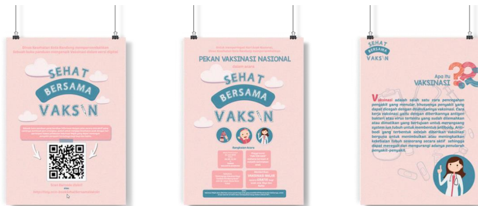
Gambar 11 Poster (media Pendukung)