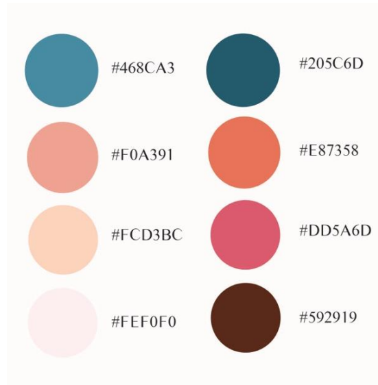
Gambar 8 Warna

Warna yang akan digunakan dalam perancangan media informasi ini adalah warna-warna komplementer dimana warna tersebut menggunakan warna yang identik dan juga kontras.