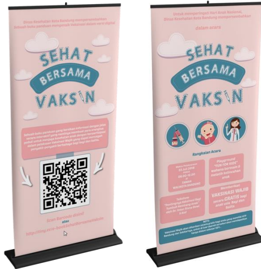
Gambar 12 X-Banner (media Pendukung)