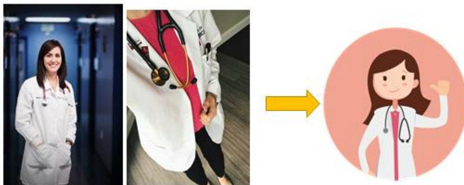
Gambar 6 gambaran bentuk Dokter