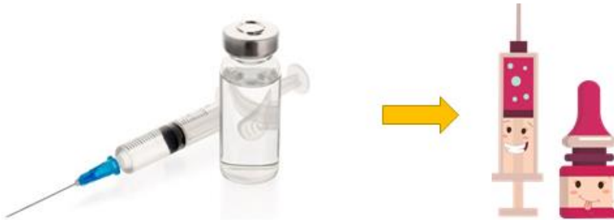
Gambar 4 gambaran bentuk Jarum Suntik dan Vaksin