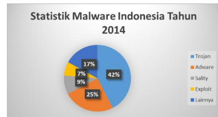
Gambar 2.1 Statistik Penyebaran Malware di Indonesia

bahwa ada 4 jenis malware yang menjadi ancaman [5].