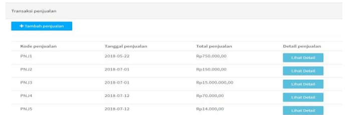
Gambar 5- 1 Daftar Piutang

Berikut ini merupakan proses aplikasi transaksi pembayaran piutang: