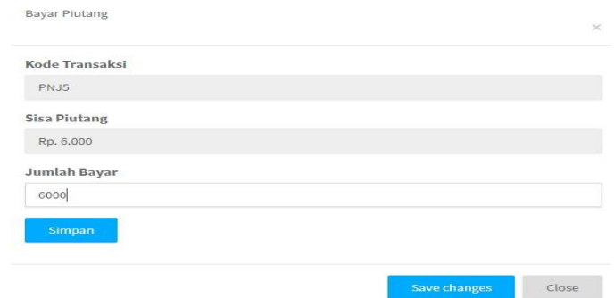
Gambar 5- 2