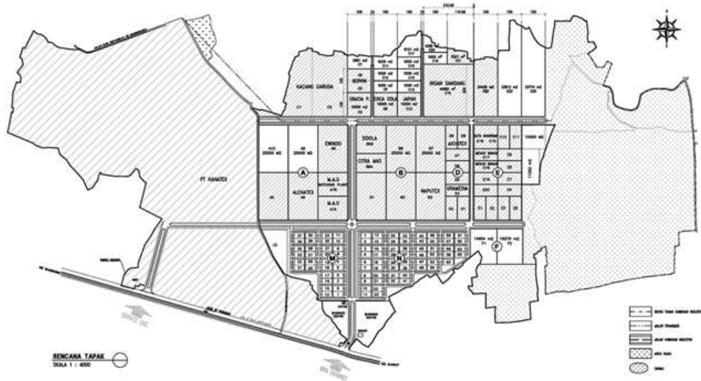
Gambar I. 2 Peta Kawasan Industri PT Dwipuri Abadi