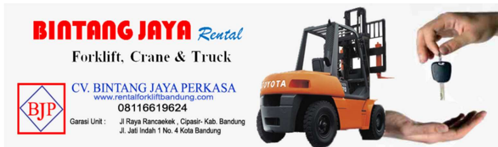
Gambar I. 3 Logo Perusahaan CV BJP