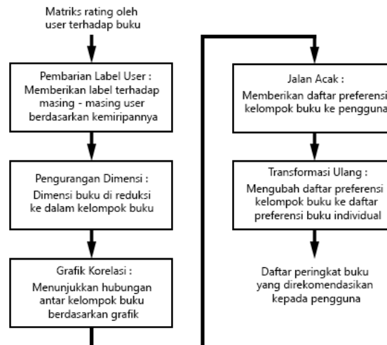
Gambar 1. Tahapan dalam metode berbasis clustering dengan algoritma self-constructing clustering

Pada metode berbasis clustering dengan algoritma self-constructing clustering , langkah pertamanya yaitu pemberian label user , digunakan algoritma self-constructing clustering untuk memberikan label terhadap masing - masing user berdasarkan kemiripannya. Pada langkah kedua, pengurangan dimensi, self-constructing clustering digunakan kembali dimana buku yang serupa dikelompokkan dalam kelompok yang sama dan buku yang beda akan dikelompokkan ke dalam kelompok yang berbeda [3]. Karena jumlah kelompok buku jauh lebih kecil dari pada jumlah buku, dimensi yang terlibat jauh lebih berkurang. Kemudian grafik korelasi akan menunjukkan hubungan antar kelompok buku yang dihasilkan pada langkah ketiga. Berdasarkan grafik korelasi, jalan acak di eksekusi dan daftar preferensi kelompok buku diturunkan untuk masing - masing user dilangkah keempat. Akhirnya, dalam transformasi ulang, preferensi daftar kelompok buku diubah ke dalam daftar preferensi buku individual, dan daftar peringkat buku akan direkomendasikan kepada setiap user [3].