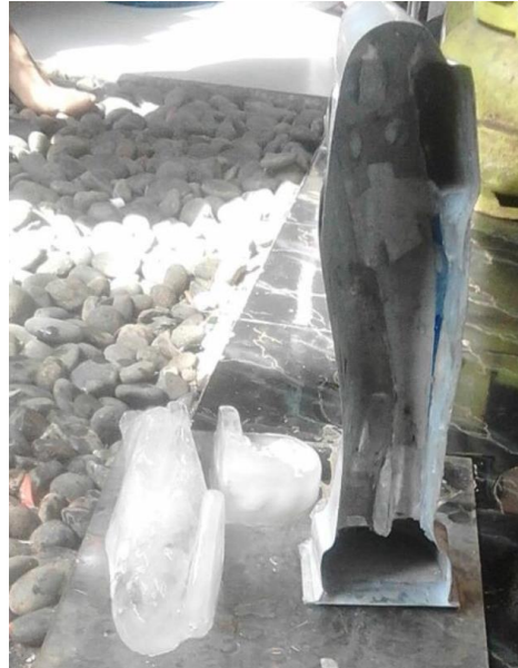
Gambar 3.5 Proses Berkarya