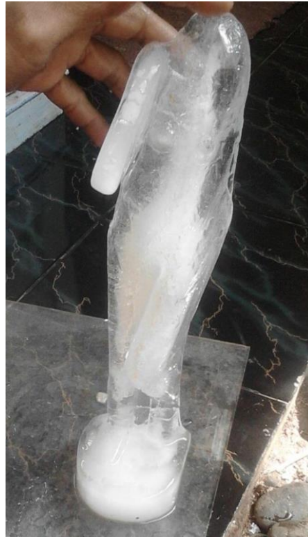
Gambar 3.6 Figure Ice