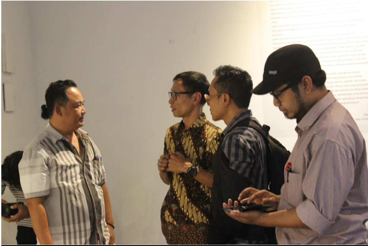
Gambar 3.10 Respon Pengunjung terhadap karya