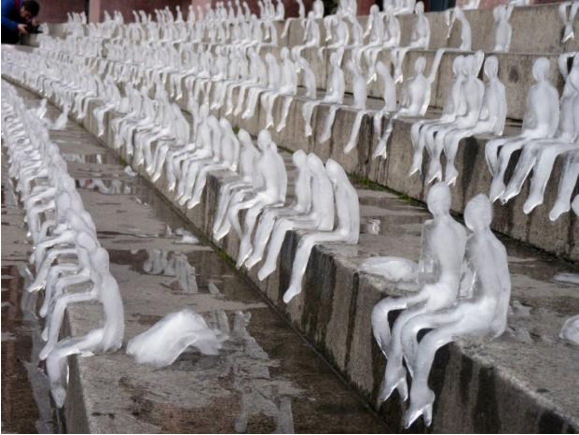
Gambar 2.6 Nele Azevedo Seniman Refrensi

http://publicinstallationart.altervista.org/nele-azevedo-biography/