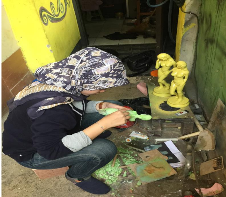
Gambar 3.1 Proses pembuatan Cetakan I