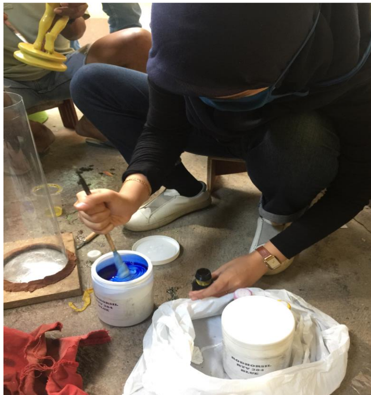
Gambar 3.2 Proses Pembuatan Karya