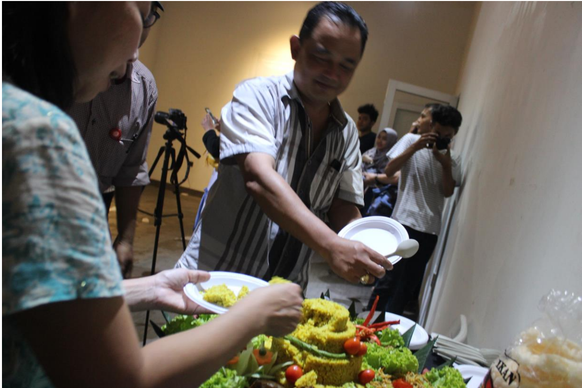
Gambar 3.12 Suasana Pameran