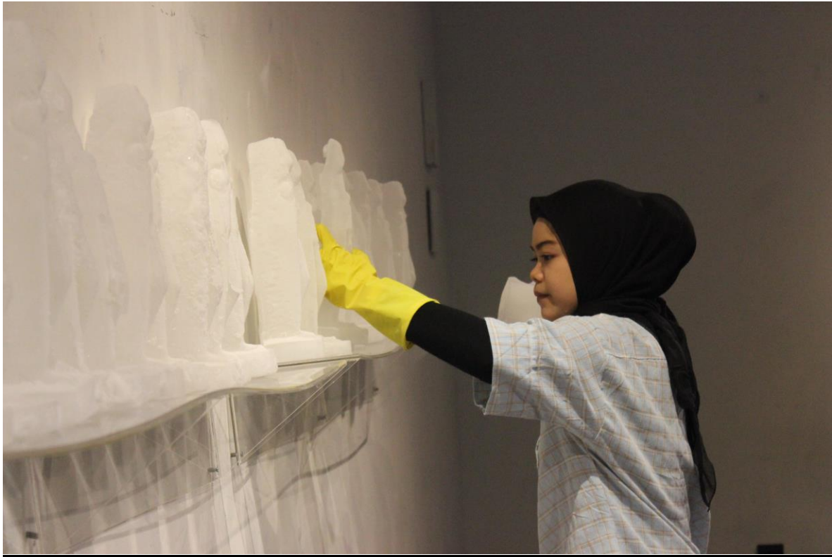
Gambar 3.9 Proses Pendisplayan