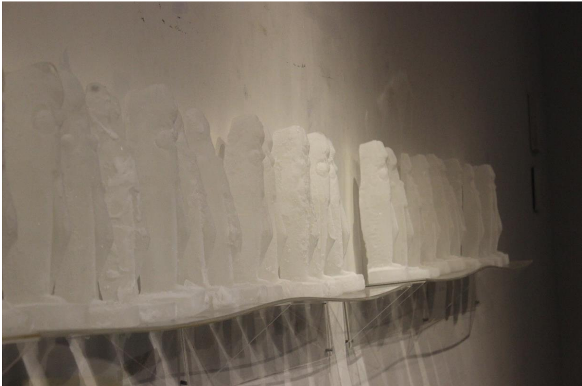
Gambar 3.8 Layout Dispay