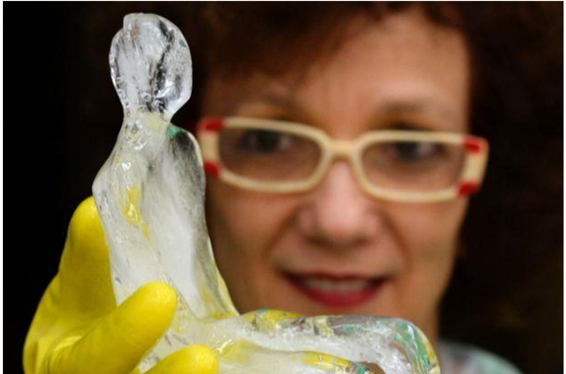
Gambar 2.5 Nele Azevedo Seniman Refrensi

http://publicinstallationart.altervista.org/nele-azevedo-biography/