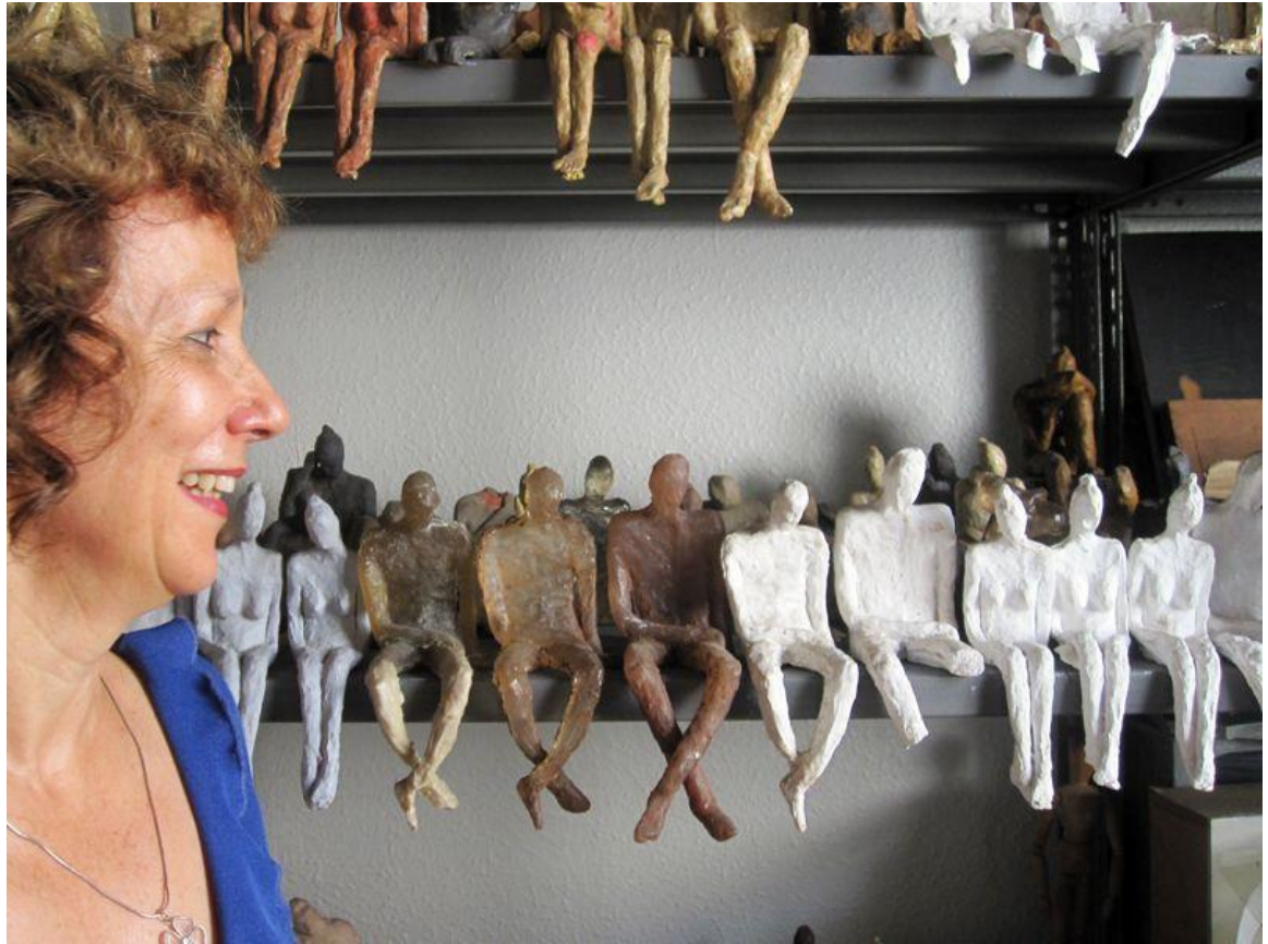
Gambar 2.4 Nele Azevedo Seniman Refrensi

http://publicinstallationart.altervista.org/nele-azevedo-biography/