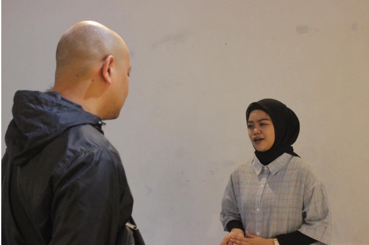
Gambar 3.7 Diskusi Dengan Pengunjung