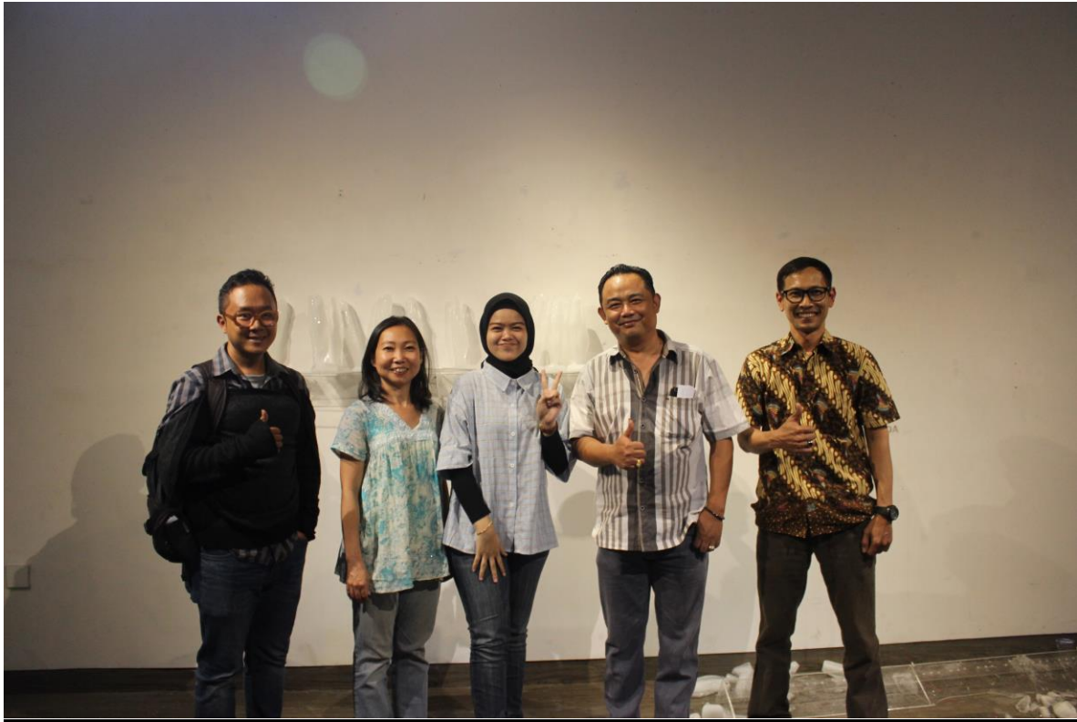
Gambar 3.11 Foto Bersama Pembimbing dan Penguji