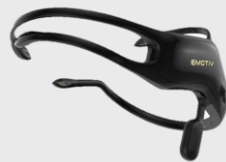
Gambar 2. 1 EEG 5 channel [3]

Electroencephalography (EEG) adalah sebuah kegiatan untuk merekam aktivitas kelistrikan yang dihasilkan oleh otak selama selang waktu tertentu. EEG menggunakan aktivitas kelistrikan neuron didalam otak. neuron akan menghasilkan lonjakan listrik ketika aktif dapat diukur dari elektrode yang ditempel di kulit kepala.[2] Alat yang digunakan pada tugas akhir kali ini adalah mindwave mobile headset yang diproduksi oleh EMOTIV.