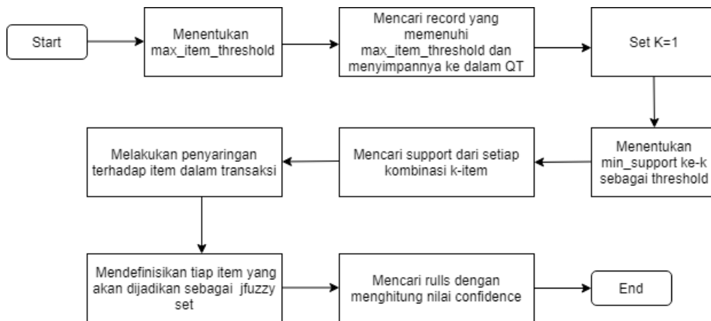
Gambar 3.2 Alur tahapan Fuzzy c-Cocering

Pada gambar 3.2 akan dijelaskan mengenai alur tahapan dalam Fuzzy c-Covering. Langkah pertama yang perlu dilakukan adalah menentukan Batasan atau max_item_threshold (ith). Setelah menentukan ith maka selanjutnya mengecek record yang memenuhi ith dan menyimpannya ke dalam QT. Lakukan set k=1 yakni k berupa jumlah kombinasi. Kemudian langkah selanjutnya yaitu menentukan minimum support sebagai batasan, mencari support dari setiap kombinasi dan akan dilakukan penyaringan pada setiap item untuk memilih yang memenuhi minimum support agar bisa melanjutkan ke tahap berikutnya. Hasil dari yang memenuhi min_sup didefinisikan tiap itemnya yang akan dijadikan fuzzy set. Setelah itu mencari rule dengan menghitung nilai confidence.