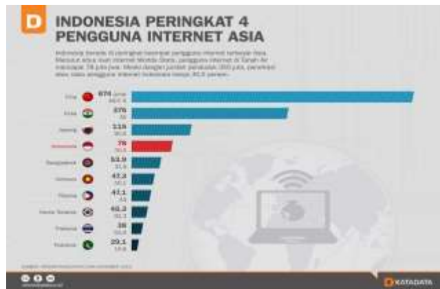
Gambar 1.3 Peringkat pengguna internet di Asia