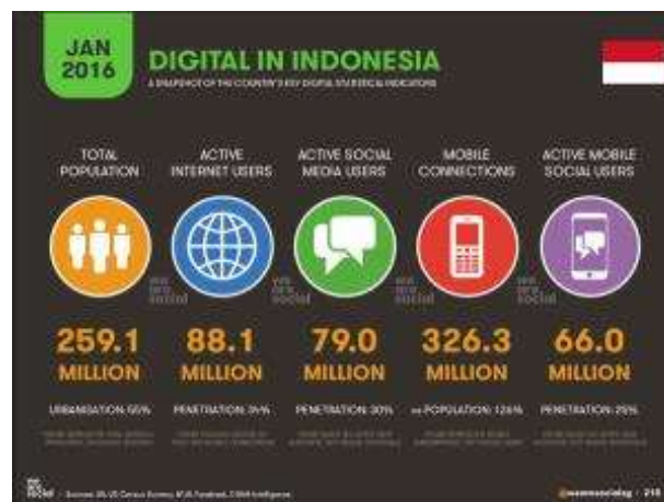
Gambar 1.4 Pengguna Internet Di Indonesia 2016

Kemajuan internet membawa banyak keuntungan, khususnya untuk masyarakat secara luas dimana kini teknologi dapat dinikmati oleh hampir seluruh masyarakat tanpa adanya batasan dan juga kesulitan. Tidak dapat di pungkiri bahwa internet telah menjadi bagian yang penting dari kehidupan manusia pada jaman modern ini. Banyak aktivitas yang dilakukan menggunakan teknologi internet. mulai dari belajar, mencari pekerjaan , bekerja, berkomunikasi, berbelanja dan menjual semua dapat diakses dengan mudah melalui internet.