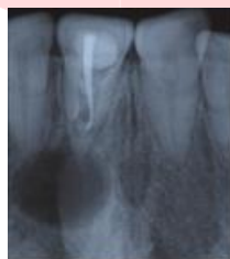
Gambar 2.1 X-ray Kista Periapikal

Salah satu alat bantu dalam kedokteran gigi untuk radiologi gigi adalah radiograf. Radiograf adalah gambaran benda yang diambil dengan radiografi. Radiografi umumnya digunakan untuk melihat benda tak tembus pandang, misalnya bagian dalam tubuh manusia. Karena tidak semua penyakit yang terjadi di gigi dapat dilihat langsung oleh kasat mata, radiografi akan membantu melihat komponen gigi yang tidak terlihat melalui pemeriksaan visual permukaan gigi. Radiograf merupakan citra x-ray hasil rontgen terhadap gigi pasien [3]. Salah satu penyakit yang perlu radiograf dalam penanganannya adalah kista periapikal. Gambar 2.1 adalah contoh x-ray gigi yang terkena kista periapikal.