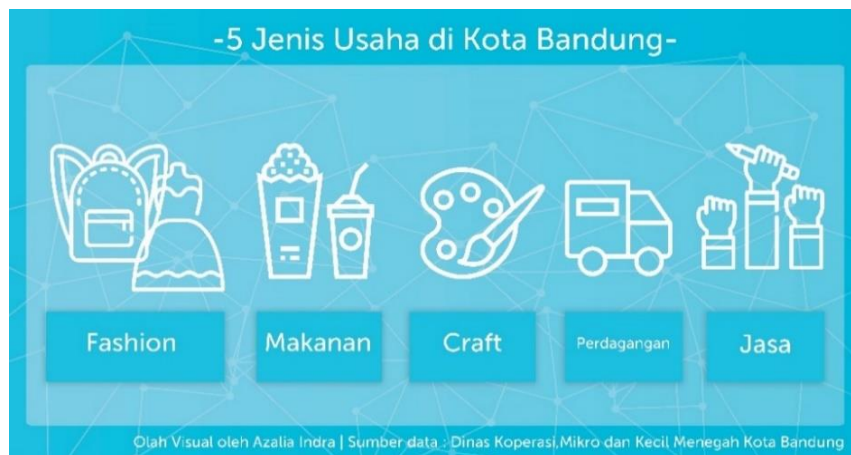
Gambar 1. 1 Jenis Usaha di Kota Bandung

Di kota Bandung, UMKM terdiri dari beragam jenis usaha. Jenis usaha di kota Bandung yang terdata hingga tahun 2017 lalu terdiri dari Fashion , makanan, craft , jasa dan perdagangan. Fashion terdiri dari pelaku usaha yang memproduksi pakaian, tas, sepatu dan asesoris pelengkap. Sementara Makanan terdiri dari pelaku usaha yang memproduksi makanan ataupun minuman. Craft , merupakan jenis usaha yang memproduksi barang seni seperti lukisan, pahat, alat musik dan produk-produk seni lainnya (Data Dinas Koperasi dan UMKM kota Bandung,2017).