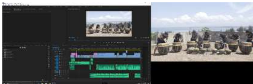
Gambar 4.2. Offline editing