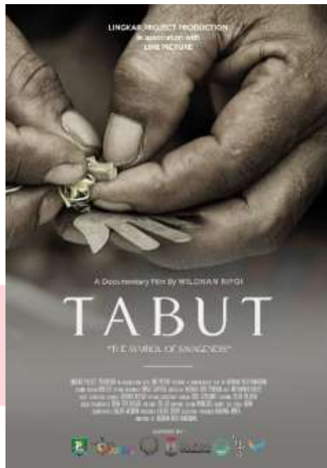
Gambar 3.7 Poster Film Dokumenter Tabut

Perancang membuat poster untuk menyebarkan informasi kepada masyarakat mengenai film dokumenter Tabut ini melalui sebuah gambar. Poster tersebut dapat disebarluaskan melalui sosial media ataupun secara langsung.