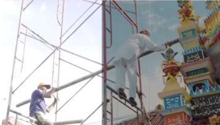
Gambar 4.3. Contoh Koreksi Warna

Sutradara memastikan konsep warna yang diinginkan ketika pra produksi sesuai dengan yang dilakukan oleh editor. Tahapan ini berfungsi untuk memberi adegan yang ada di dalam film.