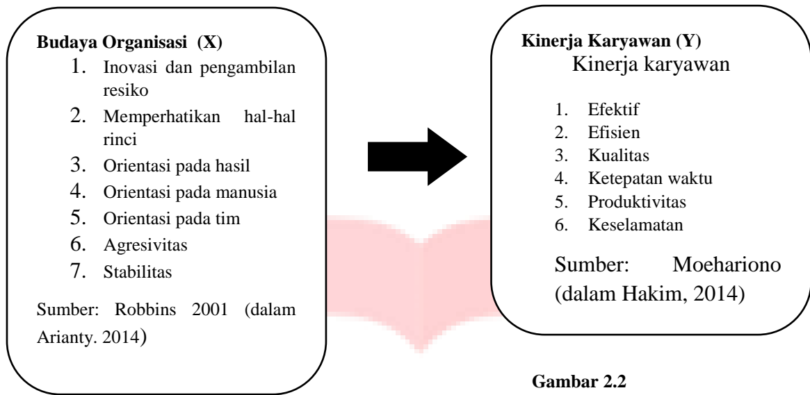
Gambar 2.2 Kerangka Pemikiran