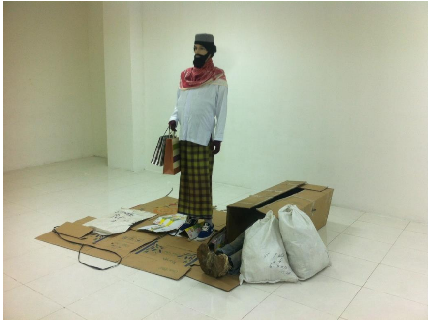
Gambar 4. Social Inequality.