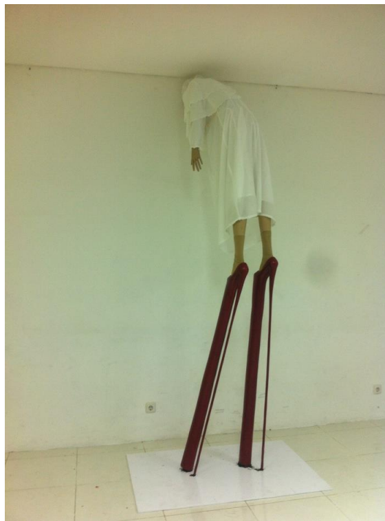
Gambar 3. Greed.