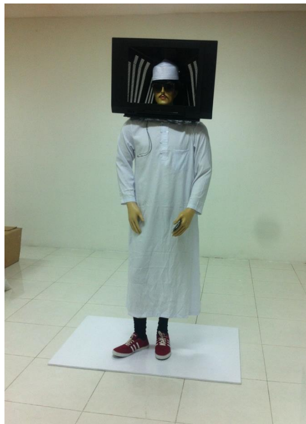
Gambar 5. Hyper-realitas.