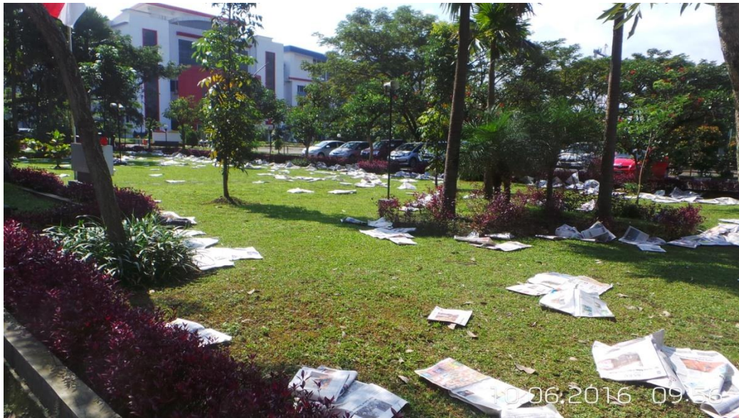
Gambar 6. Ignorance