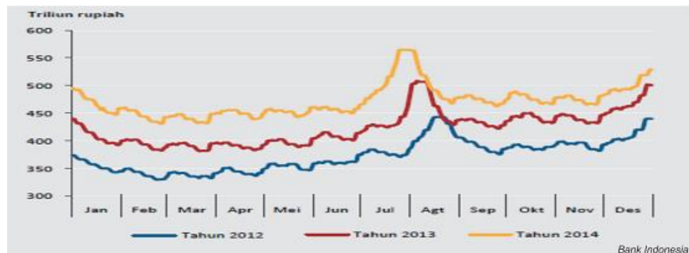
Gambar 1. Grafik UYD.

Aktivitas transaksi masyarakat Indonesia pada periode Ramadhan dan Idul Fitri setiap tahunnya terus meningkat, hal ini bisa dilihat dari laporan Bank Indonesia terkait uang kartal yang diedarkan (UYD). UYD dinyatakan selalu meningkat secara signifikan selama periode ramadhan setiap tahunnya, seperti pada grafik yang tercantum.