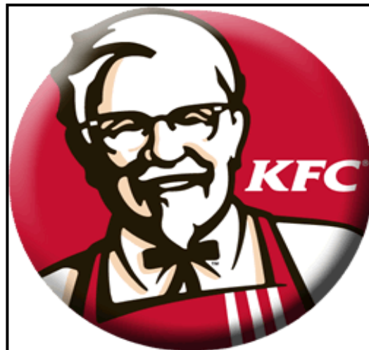
Gambar 1.1 Logo KFC

PT. Fastfood Indonesia, Tbk. didirikan oleh kelompok usaha Galael pada tahun 1978, dan terdaftar sebagai perusahaan publik sejak tahun 1994. Perseroan mengawali usaha warabala dengan pembukaan restoran Kentucky Fried Chicken ( KFC ) pertama pada bulan Oktober 1979 di Jalan Melawai, Jakarta. Kesuksesan outlet ini kemudian diikuti dengan pembukaan outlet-outlet selanjutnya di Jakarta dan perluasan area cakupan hingga ke kota-kota besar lain di Indonesia, antara lain Bandung, Semarang, Surabaya, Medan, Makassar, dan Manado. Keberhasilan yang terus diraih dalam pengembangan brand menjadikan KFC sebagai bisnis waralaba cepat saji yang dikenal luas dan dominan di Indonesia. Berikut logo dari Perusahaan KFC dapat dilihat pada gambar 1.1 di bawah ini: