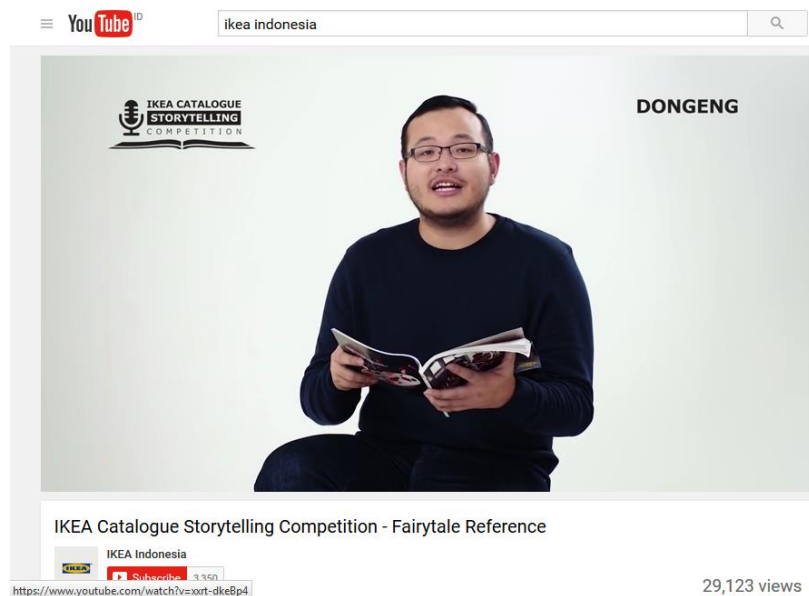
Gambar 1.2 Tampilan Storytelling Campaign IKEA

Bila diamati hampir semua iklan IKEA memanfaatkan teknik storytelling dalam menceritakan produk yang dimilikinya. IKEA menceritakan kelebihan, keunggulan, bagaimana produk dibuat layaknya menceritakan sesuatu hal kepada manusia. Hal ini menjadi sesuatu yang unik dan berbeda dari cara perusahaan memasarkan produk pada umumnya.