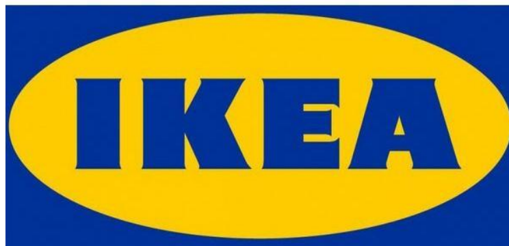
Gambar 1.1 Logo Perusahaan IKEA

Salah satu perusahaan yang menerapkan teknik storytelling dalam memasarkan produknya adalah IKEA Indonesia. IKEA adalah perusahaan yang bergerak di bidang furniture atau perabot rumah tangga dengan kantor pusat di Swedia. Pada tanggal 15 Oktober 2014 IKEA resmi membuka gerai pertamanya di Indonesia terletak di Alam Sutra, Tangerang, Indonesia dan menjadi toko ke-364 dan yang paling baru dari 46 negara di dunia. Berbagai benua yang ikut membangun gerai IKEA di negaranya adalah Amerika Utara dengan 52 toko, Amerika Tengah dengan 1 toko, Eropa dengan 262 toko, Timur Tengah dengan 12 toko, Asia dengan 40 toko dan Australia dengan 8 toko. Total toko keseluruhan adalah 375 toko di 46 negara.