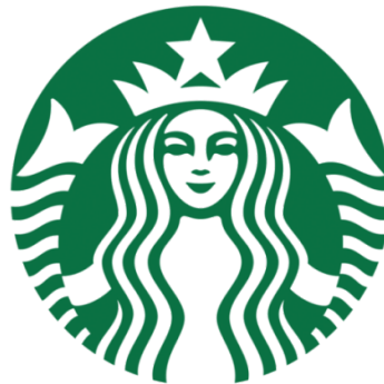
GAMBAR 1.1 Logo Starbucks

Kesuksesan Starbucks juga diduga oleh banyak orang dari logonya. Logo Starbucks diambil dari salah satu karakter dalam novel terkenal Moby Dick berasal dari Yunani yang berupa putri duyung berekor dua yang biasa disebut Dewi Siren. Putri duyung ini mempunyai fisik yang menarik dan ia memanfaatkan itu dengan merayu lawan jenis untuk mendapatkan perhatian. Simbolisme Dewi Siren dijadikan logo Starbucks dengan maksud semua produk Starbucks dapat menarik semua konsumen.