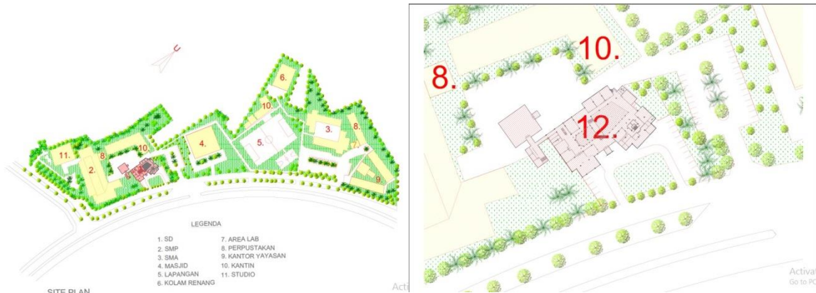
Gambar 1.1 Site Plan

Batas perancangan yang dilakukan penulis hanya berpusat pada teritori Sekolah Dasar saja tanpa penambahan pada kawasan Pendidikan lainnya.