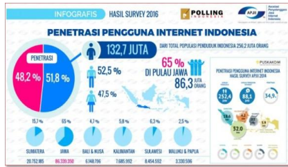
Survei Pengguna Internet di Indonesia tahun 2016

Berdasarkan survei yang dilakukan dan dikemukakan www.apjii.or.id adalah jumlah pengguna internet di Indonesia tahun 2016 yaitu 132,7 juta user atau sekitar 51,5% dari total jumlah penduduk Indonesia sebesar 256,2 juta. Pengguna internet terbanyak ada di pulau Jawa dengan total 86.339.350 user atau sekitar 65% dari total pengguna internet. Menurut Hidayat, R., & Hidayat, A. M. (2017) dalam jurnalnya menjelaskan bahwa kegiatan bisnis seperti toko online mendapat respon yang positif dari masyarakat yang lebih memudahkan mereka dalam aktifitasnya. Bisa dikatakan kebutuhan masyarakat akan internet sangat tinggi.