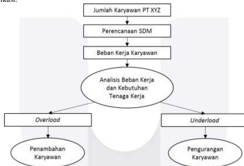
Gambar 3.1 Model Konseptual

Model konseptual pada Gambar III.1 merupakan gambaran yang digunakan penulis untuk memudahkan dalam mengidentifikasi dan menyelesaikan permasalahan dalam pemetaan kebutuhan tenaga kerja berdasarkan beban kerja karyawan. Model konseptual menunjukkan hubungan dan pengaruh antara variabel penelitian untuk kemudian diidentifikasi.