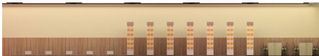
Gambar 4.11 Tampak Interior Area Baca Individu, Area Baca Lesehan & Koleksi Buku.