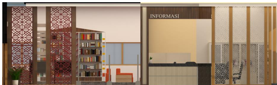
Gambar 4.9 Tampak Interior Lobby & Pelayanan.