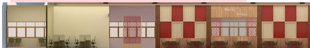
Gambar 4.10 Tampak Interior Area Baca Individu & Area Baca Kelompok.