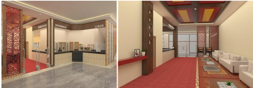
Gambar 4.2 Area Lobi Lantai 1 Perpustakaan Daerah.

dan loker penyimpanan barang. Perancangan kali ini penulis menggabungkan 3 area dengan bagian masing-masing.