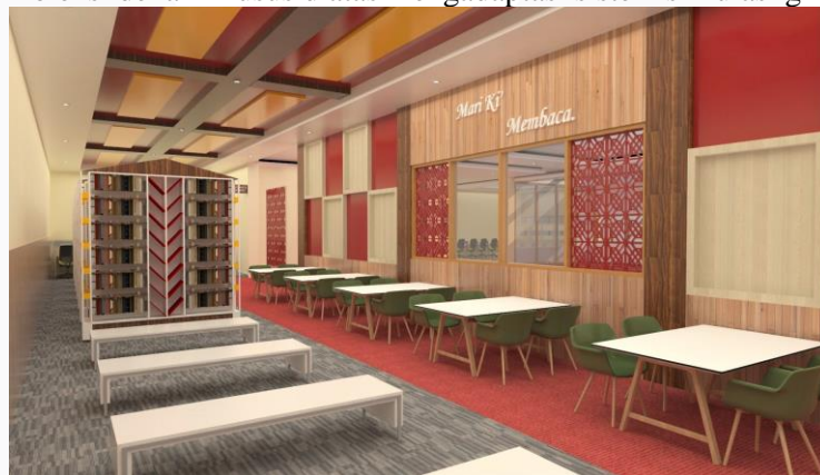
Gambar 4.3 Area Baca dan Koleksi Buku Perpustakaan Daerah.