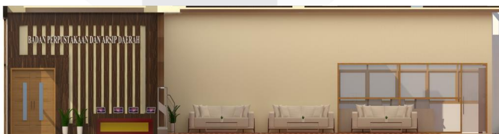
Gambar 4.8 Tampak Interior Lobby & Lounge.