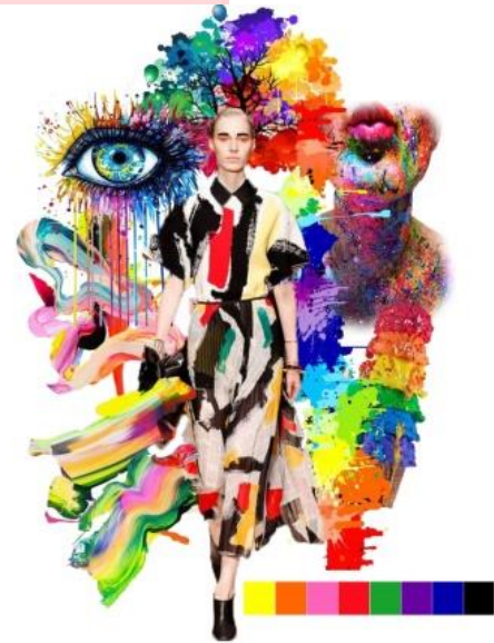
Gambar 1. Konsep Imageboard

menjadi trendsetter . Tema ini diciptakan untuk membuat kesan yang penuh warna, ceria, unique , dan memiliki kepercayaan diri serta unsur yang sulit ditebak melalui emosi seseorang.