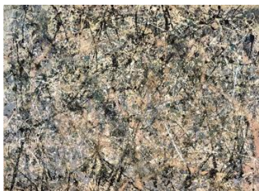
Gambar 2.3 : Jackson Pollock, Lavender Mist, 1948

menggunakan tangan dan pergelangan tangan, karena ia menggunakan seluruh tubuhnya untuk melukis. Pada tahun 1956, majalah Time dijuluki Pollock "Jack the ripper" sebagai hasil dari gaya lukisan yang unik. Pollock meninggal pada usia 44 dalam sebuah kecelakaan mobil yang berhubungan dengan alkohol.