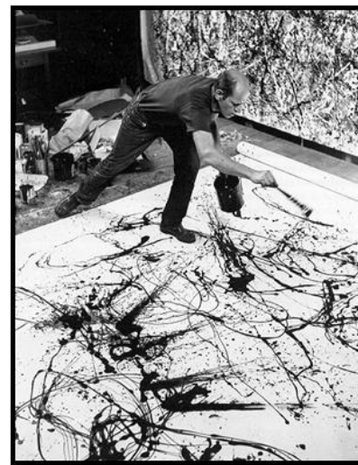
Gambar 2.2 : Jackson Pollock

http://sikatxdesign.blogspot.co.id/2012/11/lukisan-menetes-jackson-pollock.html