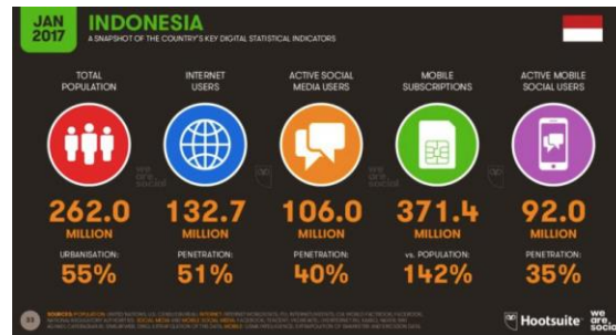
GAMBAR 1.3 Persentase Pengguna Internet di Indonesia

Sejalan dengan pesatnya teknologi informasi dan komunikasi, teknologi transportasi pun tak kalah berkembang pesatnya. Saat ini banyak bermunculan jasa transportasi online di Indonesia seperti GO-JEK, Grab, Uber, dan lain-lain. GO-JEK merupakan salah satu penyedia layanan jasa transportasi online khususnya sepeda motor. GO-JEK adalah perusahaan berjiwa sosial yang memimpin revolusi industri transportasi Ojek, juga GO-JEK menawarkan banyak layanan selain transportasi, namun dalam penelitian yang diangkat menjadi objek adalah GO-RIDE. Berkembangnya bisnis transportasi online , membuat perusahaan GO-JEK harus selalu mengevaluasi layanan yang diberikan, seperti driver berkendara dengan benar dan hati-hati, driver memakai atribut GO-JEK agar mudah dikenali, sopan dan santun, berpenampilan bersih dan rapi. Hal tersebut sangat berpengaruh terhadap kenyamanan konsumen dan berdampak pada pemesanan secara berulang oleh konsumen. Selain itu, karena dalam hal ini adalah transportasi, perusahaan harus mampu membangun dan menjaga kepercayaan konsumen, seperti citra perusahaan yaitu sebagai transportasi yang aman dan tidak memiliki histori kriminal. Menurut Hidayat (2016:305) berubahnya pasar menjadi 3.0. ini memacu para produsen untuk tetap melakukan inovasi, agar tetap konsisten ditengah persaingan pasar yang semakin ketat.