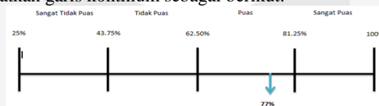
GAMBAR 3.1 Garis Kontinum Bauran Promosi T-cash

Dari Tabel di atas, maka didapatkan garis kontinum sebagai berikut: