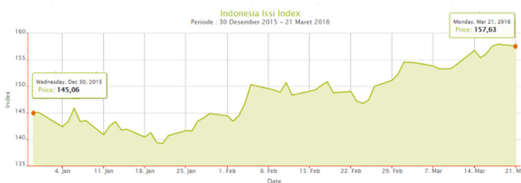
Gambar 1.2 Pergerakan ISSI Year-to-Date (YTD)