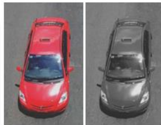
Gambar 2.1 Grayscale Filter .

Pre-processing adalah proses penting dan merupakan tugas utama yang harus dilakukan pada deteksi gerak objek. Karna, perubahan kecil yang terjadi pada piksel dapat menyebabkan kesalahan dalam deteksi dan dapat mengakibatkan munculnya noise . Pada pengolahan citra, noise adalah setiap entitas yang tidak bermanfaat yang ada pada citra. Noise dapat mengakibatkan kesalahan dan kegagalan dalam proses deteksi. Cara yang digunakan untuk mengurangi noise adalah dengan menggunakan filter [9]. Tujuan dilakukan pre-processing adalah untuk menghilangkan noise , memperjelas fitur data, mengkonversi data asli ke bentuk lain [9]. Pre-processing yang dipakai dalam penelitian kali ini adalah Grayscale filter dan Gaussian blur filter .