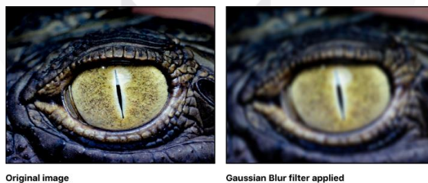
Gambar 2.2 Gaussian Blur Filter .