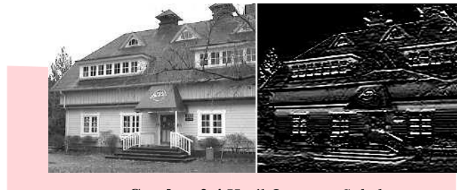
Gambar 2.4 Hasil Operator Sobel.