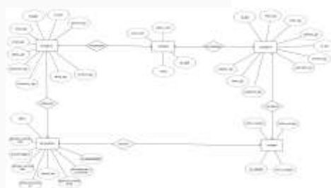
Gambar 7 ERD

Pemodelan awal basis data menggunakan Entity Diagram (ERD) untuk menjelaskan hubungan antar basis data berdasarkan objek-objek dasar data yang mempunyai hubungan antar relasi, sebagaimana gambar berikut: