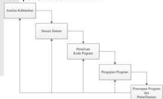
Gambar 1 Model SDLC

Metode pengerjaan menggunakan metode SDLC ( Software Development Life Cycle ) model waterfall adalah model SDLC yang paling sederhana. Karena model ini sangat cocok digunakan untuk pengembangan perangkat lunak dengan spesifikasi yang tidak berubah-ubah. Pengerjaan dengan metode ini tidak sampai pada tahap penerapan program dan pemeliharaan.