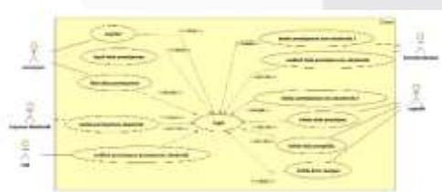
Gambar 8 Use Case Diagram

Pemodelan sistem menggunakan Use Case diagram untuk menjelaskan hubungan antara aktor dan fungsionalitas aplikasi, sebagaimana gambar berikut: